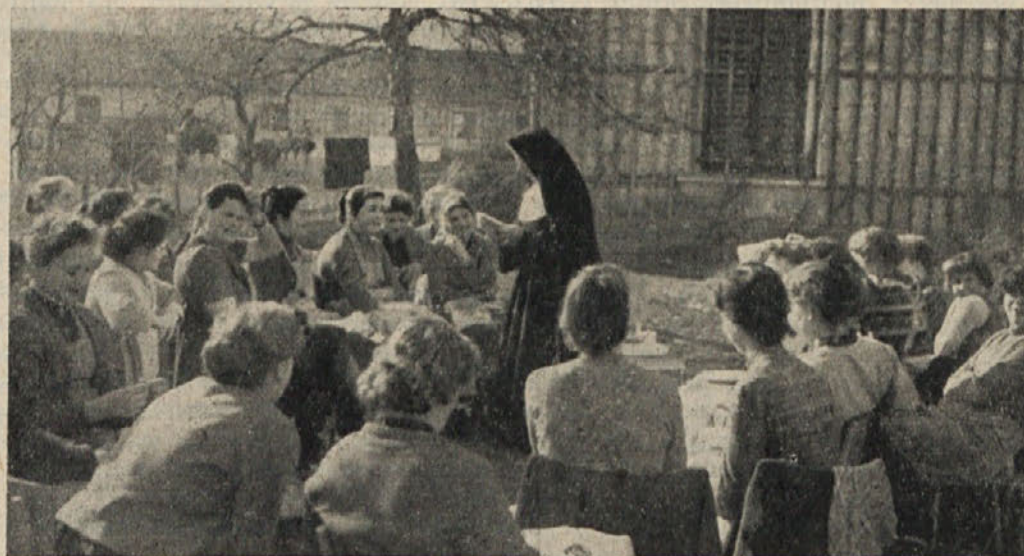
Gojenke gospodinske šole č. sester v Št. Rupertu pri pouku