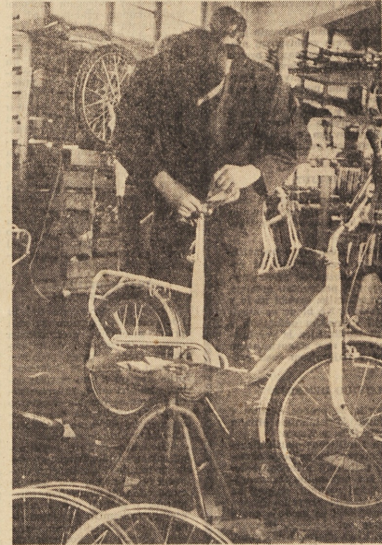
Zložljiva dvokolesa Ponny, ki jih izdelujejo v ljubljanski tovarni Rog, niso samo modni krik, temveč so res privlačna ter, kar je še posebej pomembno, tudi praktična.

tedensko rekreacijo, manj pa naj bi ga trošili za razne sindikalne veselice in podobno. »Se bodo po vašem zgledu ravnale tudi druge sindikalne organizacije v delovnih kolektivih bežigradske občine in v okviru počitniške skupnosti Alpe Adria poslane svoje delavce na preventivno letovanje?« »Menim, da bi morale počitniško skupnost Alpe Adria podpreti vse sindikalne organizacije, zlasti zato, ker si ta vse bolj prizadeva omogočiti delavcem ceneno, bodisi preventivno ali redno letovanje. Z veseljem lahko ugotavljam, da počitniška skupnost Alpe Adria že deluje v tej smeri, da bi uvedla kvaliteten delavski turizem, ki ne bi smel vedno sloneti na ekonomski računici, marveč tudi na raznih popustih pri dnevni oskrbi. Kajti takšna in podobna letovanja delavcev niso nobena sociala, marveč le načrtno vlaganje v človeka, da bo posledj sposoben še več in še bolje proizvoditi.«