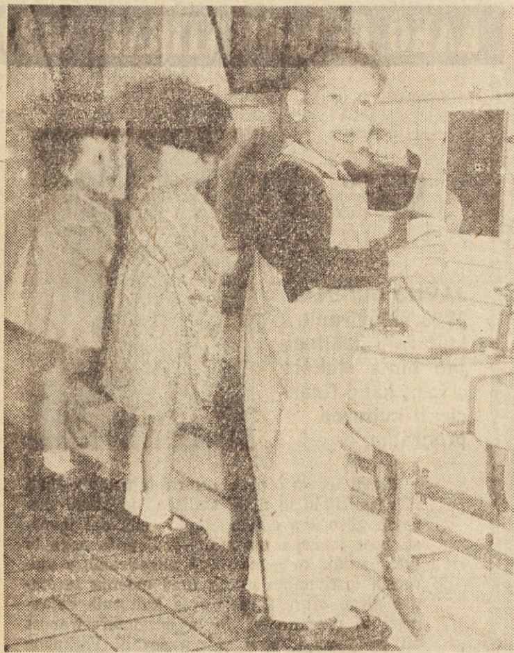
V prihodnji številki Delavske enotnosti bomo objavili odgovor Republiške skupnosti socialnega zavarovanja delavcev SRS na naš članek »Ali sedelovanje strokovnjakov ni potrebno?«, objavljen v 5. številki Delavske enotnosti dne 11. februarja, ki povzema mnenje zobozdravstvene komisije pri medobčinskem zdravstvenem centru v Ljubljani o udeležbi zavarovancev za zoboprofetična dela. Hkrati bomo objavili tudi pripombe omenjene medobčinske zobozdravstvene komisije na odgovor republiške skupnosti socialnega zavarovanja delavcev SRS

Na sodiščih obravnavani primeri kažejo med drugim na pomanjkljivosti v notranjih predpisih delovnih organizacij: na to, da v kolektivih večkrat ravnavajo neobjektivno ter navajajo razloge za prenehanje dela, čeprav ti niso podani; nadalje, da postopke zaradi kršitev delovne dolžnosti, neradi uvajajo ter raje sklenejo, da delo prenehaj iz katerega drugega neutemeljenega razloga, da pristojni organi in seveda tudi delavci ne poznajo dovolj predpisov o delovnih razmerjih in končno, da se skušajo delovne organizacije marsikdaj iznebiti delavca tudi iz neutemeljenih subjektivnih razlogov. K. S.