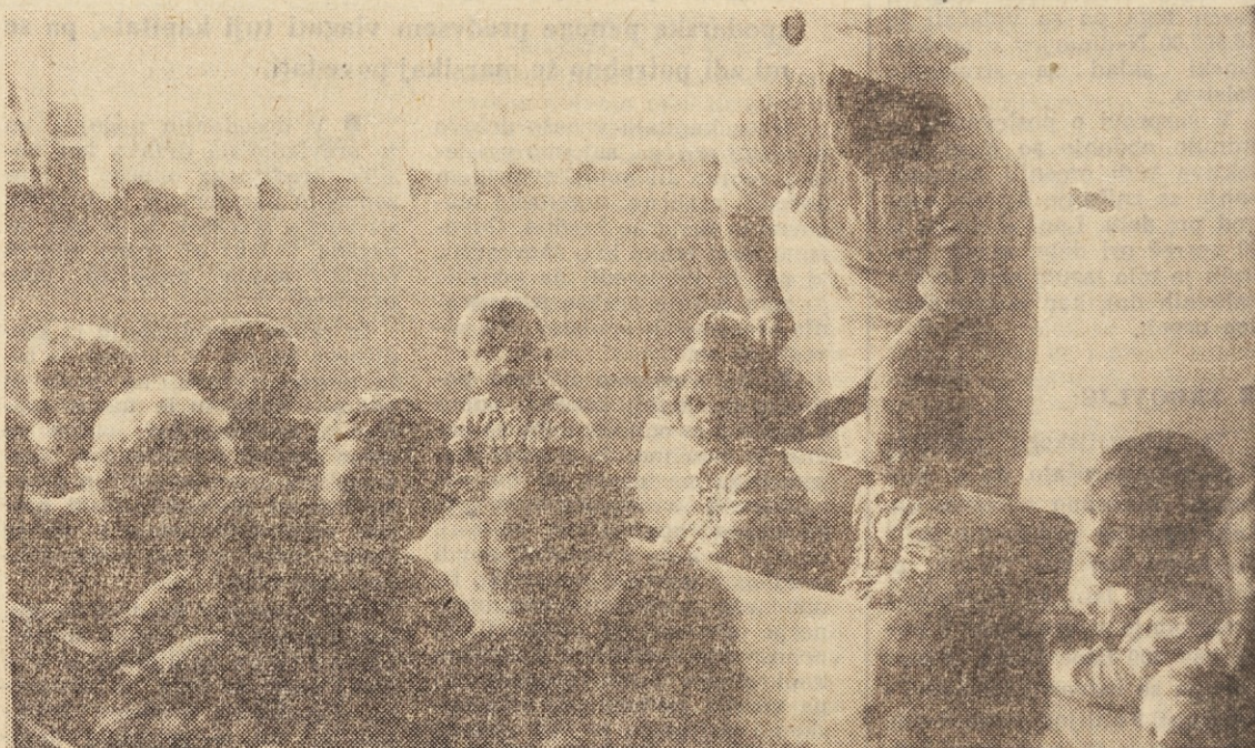
Takole bi bili radi »spravljeni«, medtem ko mamica in očka delata

Vznemirjenje na Jesenicah ni brez osnov. Občina, ki jo uvrščajo med industrijsko razvite, ima med 13 tisoč delavci samo 27% žensk. Slovensko povprečje je skoraj dvakrat večje, saj ženske zasedajo zdaj že okoli 46% vseh delovnih mest. Zaposlenost žensk v nekaterih drugih državah pa je še večja. Na primer v Vzhodni Nemčiji, deželi ženskih tekočih trakov, je od vseh zaposlenih kar 70% žensk, v Sovjetski zvezi pa 47%. Tudi zaposlenost žensk v razvitih zahodnih industrijskih državah je visoka. V Zahodni Nemčiji je na vseh delovnih mestih v državi 36,2% žensk.