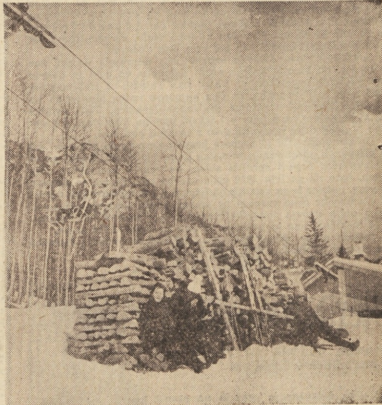
Zadnja lepa nedelja je bila kriva temu, da je le malokdo ostal za mestnimi zidovi. Mnogi so se hoteli naužiti tudi snega, seveda v hribih, kajti doline so že dolgo kopne. Za Ljubljancane, čeprav ne samo zanje, pa je bil še posebej privlačen Ljubelj, pravzaprav smučišča na Zelenici. Od tod so tudi naši trije posnetki. In medtem ko so se nekateri zares športno izživljali, so se drugi odločili za bolj »penzionistovsko nedeljo«, tretji pa, teh ni na naših slikah, pa so ostali raje na toplem — za točilno mizo... Pa saj je tudi v tem rekreacija!