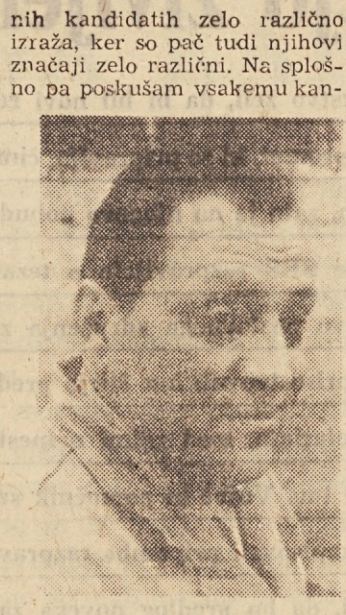
didatu dopovedati, naj ukrepa preudarno in tudi pravočasno. Predvsem pa gre za to, da mora pri praktični vožnji bodoči šofer poslušati svojega inštruktorja in ravnati tako, kot mu nasvetuje. Iz lastne

jo, da se prek teoretičnega dela voznškega izpita z uspehom prekoplje več kot 90 % tistih kandidatov, ki so obiskovali teoretične tečaje, kakršne prireja tudi naše društvo. Izmed ostalih kandidatov, ki niso hodili na tečaje, pa teoretični del izpita naredi le polovica prijavljencev. Vendar to ni edina korist, ki jo imajo bodoči šoferji, če se odločijo tudi za teoretično pravico. Tudi sicer namreč izkušnje opozarjajo, da se pač s tem in z drugim v prometu spretnije izogibajo tistim, ki so se podkovali tudi s teorijo.