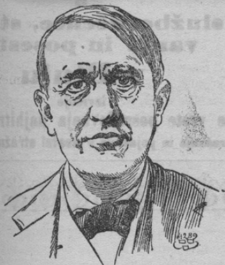
Thomas Alwa Edison

Iznajditelj in fizik Tomaž Alwa Edison, katerega sliko danes prinašamo, praznoval je dne 10. t. m. svoj 70. rojstni dan. Edison bil je leta 1947 v Milanu (Ohio) rojen. Pričel je svoje življenje kot časnikarski deček in je