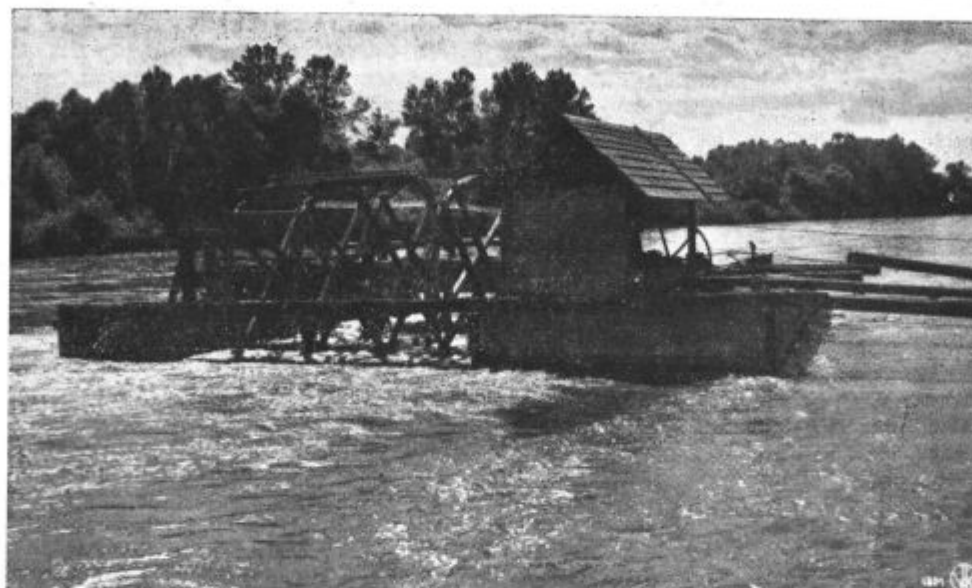
Motiv iz Prekmurja