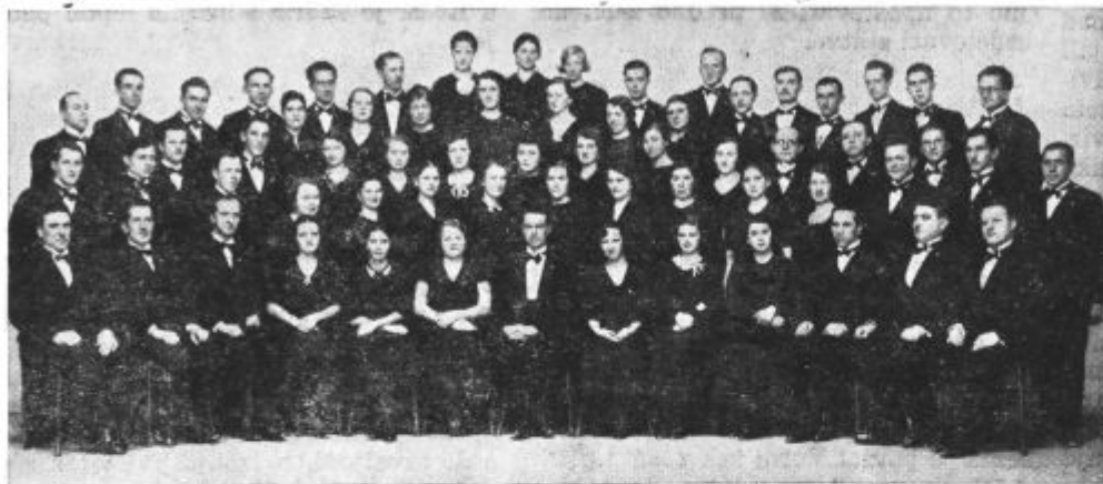
Pevci in pevke enega naših najbolj znanih pevskih zborov — »Ljubljanskega Zvona«, ki nastopi v radiu 2. junija t. l. ob 20.

Ipavca, skladatelja starejše dobe, je bil Emil Adamič delaven in najproduktivnejši skladatelj sedanje dobe. Ni danes pevskega koncerta, na katerem bi se ne izvajalo Adamičevih del. Ni pisal samo težkih in zanositih skladb. Vedel je, da je treba narodu tudi lahkih pesmic, da jih lahko prepevajo še tako majhni in preprosti zbori. Zelo rad je posegal po narodni pesmi in jo prirejal ali za mešan, moški in pa tudi za ženski zbor. Težko je reči, katera njegova dela so boljša. Vsega se je lotil z ljubeznijo. In če bo slovenski narod tudi tako z ljubeznijo prepeval, nam bo ta pesem ostala za vedno in se ni bati, da bi nam jo mogel kdo vzeti.