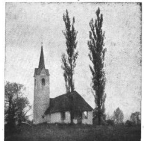
Cerkev sv. Marka v Vrbi.

šeni vitez ostane. Tedaj pa se goščava razmakne in iz nje se zgrinjajo duhovi in obstopajo v zoni trepetajočega viteza, ki se je v mnenju, da mu oznanjajo smrt, zgrudil na tla in zaril glavo v travo, da ne vidi groznega prvida. Družba duhov — preoblečenih znancev — se množi in pleše skrivnostni ples ob trepetajočem vitezu. A končno se skrivnost razodene in prestrašeni vitez, ki je bil deležen tudi udarcev, spozna potegavščino. Toda njegova moč je pri kraju in skesan prosi vso družbo oproščenja. — Potegnjen pa je tudi gospod Ford, ki je misleč, da je v meniha preoblečenemu dr. Cajusu izročil svojo hčer za nevesto, povezal roki Nannette in Fentona. Toda ob veselem razpoloženju družbe se vda željam večine in polnočna zabava se zaključi v radostnem smehu: Svet je predpustni oder in mi smo norci v njem; a kdor se smeji poslednji, ta se najbolje smeji.