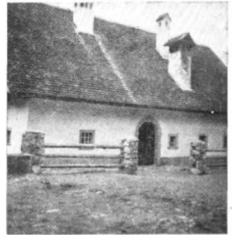
Prešernova rojstna hiša v Vrbi.

ljena postava viteza Falstaffa, našemljenega v lovca Herneja in okrašene-ga z jelenjimi rogovi. Vsi se poskrijejo, Falstaff pa korači proti dogovorjenemu hrastu s tiho grozo v srcu, a vendar opojen od sladkih nad. Ura bje polnoči — in res se iz temnega drevja izviije Alice in hiti v objem razneženega viteza. Toda že prihite razburjene gospe z novico, da se bliža divji lov. Vse se razkropi, le prestra-