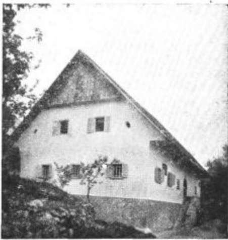
Prešernova rojstna hiša.

Pageovo potegnil. Toda Bardolf in Pistola sta naenkrat začutila na dnu svojih duš dostojanstvo moške časti in trdovratno odklanjata sodelovanje v takem nečednem podvzetju. Sedaj je pošlo siru Falstaffu potrpljenje. Služabnikom razjasni znameniti nazor o moški časti, nato ju zapodi iz službe; pismi pa pošlje po svojem pažu na označena naslova.