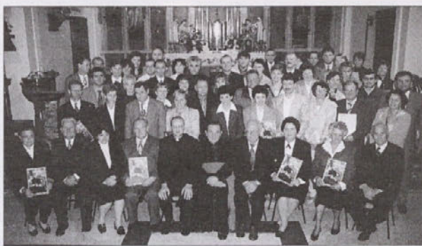
Na fotografiji zakonci - jubilaranti po končani slovesnosti v cerkvi sv. Janeza Krstnika v Preski.