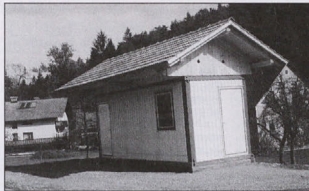
Sedež krajevne skupnosti

Golo Brdo že zdavnaj več ne pristoji svo-