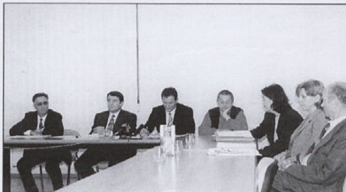
Novinarska konferenca, ki jo je sklical župan.

Čprav kritičnih pripomb in neprijetnih vprašanj torej po telefonu ni bilo, je župan z ekipo razlagal ugotovitve iz poročila in poudaril, da so ugotovitve Računskega sodišča točne in jim ne oporeka. Tako je problematika, ki so jo spremljali gledalci medvoške televizije, po novinarski konferenci in okrogli mizi, vzbujala nekakšno negotovost. Hude kršitve, omenjane na tiskovni konferenci po eni strani in razlaga župana s sodelavci po drugi, ki ni dajala vtisa o naravnost kriminalnih početjih.