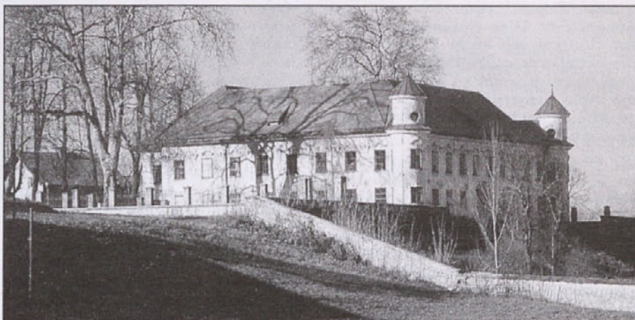
Dvorec Goričane že nekaj let obnavljajo. Vanj je bilo vloženo že veliko sredstev in pričakovanja so velika. V naslednjih nekaj letih se pričakuje, da bo zopet v takšni funkciji, kot je nekoč že bil.