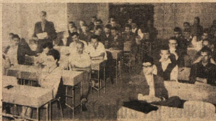
Prva seja novega CDS

V letošnjem letu se je pokazala potreba po ponovni spremembi pravilnika. S to spremembo naj bi se spremenilo število točk za nekatera delovna mesta glede na nove pogoje dela ali iz drugih vzrokov. Ob tej spremembi se bo nekoliko povečalo število točk v povprečju za vsa delovna mesta.