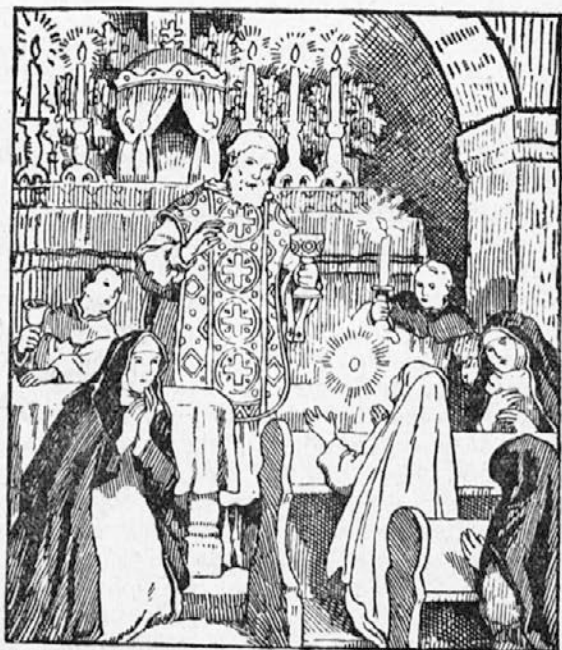
Blažena Imelda, zavetnica prvoobhajancev.