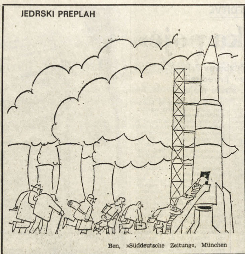
Ben, »Süddeutsche Zeitung«, München

Sejem Alpe Adria, ki je stičišče sodelovanja med sosedni, vdel prerašča svoj prvotni namen, predvsem pa svoje poimenovanje. Prehaja v vse bolj splošen potrošniški obseščevalni sejem, kjer bosta turizem in človekov prosti čas še igrala vso vlogo. V pisani ponudbi pa naj bi vsako leto videli vsaj nek prvake. Več kot letos.