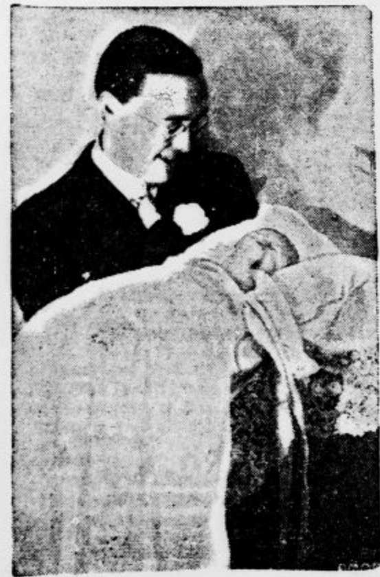
Prince Lippe-Blankenstein s svojo prvorojenko, princico Beatriko Viljemino. Soprog princice Julijane je, kakor kaže pričujoča slika, zdaj že okroval