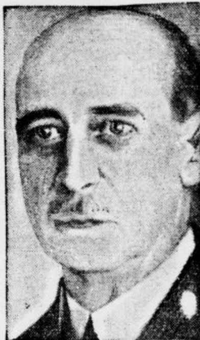
oče kneginje Olge in vojvodinje Kentske, ki je te dni umrl v Atenah. Bil je velenadarjen slikar in je razstavljal svoje slike v Parizu