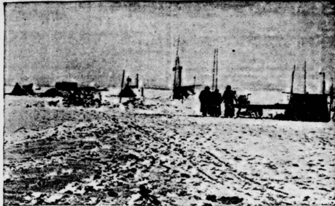
Skladišče z zalogo živil na tedni plošč