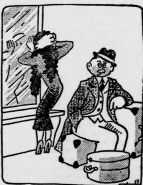
»Kaj misliš, možiček, ali bova še dobila vlak, ki odhaja ob sedmih in postaje?« »Prav gotovo, ženica. Do vlaka ob sedmih imava malo manj ko 24 ur časa.«