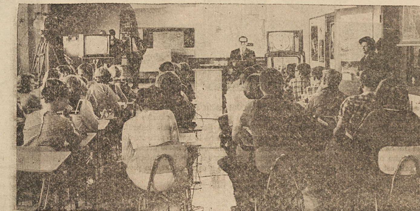
HALO, PARIZ! — V višji šoli v W. Bendu v Wisconsinu so mogli učenci enega razreda med francosko uro govoriti neposredno s Parizom preko "Zgodnje ptice". To je bil prvi pouk te vrste ob sodelovanju ameriške in francoske televizije.

Hiša naprodaj Lepa zidana hiša, 4 spalnice, severno od bulevarda, v Euclidu. V srednjih 20h. Na 45 E. 216 St. RE 1-5507. (149)