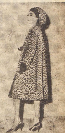
Krzneni plašč so sanje vsake ženske. Letos jih moda še prav posebno priporoča. Seveda ne lepe ce takšnemu plašču iz leopardove kože, kot ga imamo na sliki!

Vse te spremembe, ki so v naravi pač neizbežne, nas pripeljejo do zaključka, da se moramo pri izbiri barv za našo garderobo, ravnati po našem sedanjem izgledu.