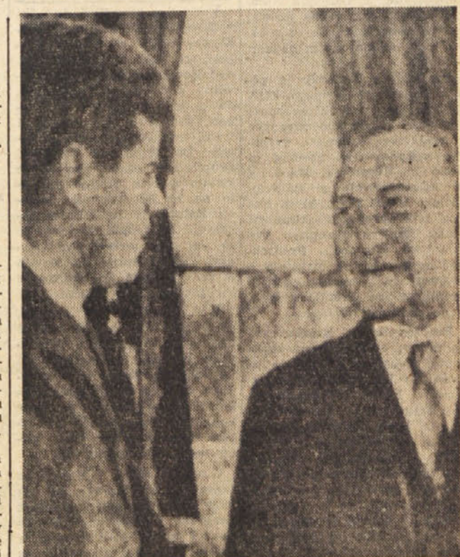
Kennedy in Adenauer med razgovorom v Washingtonu