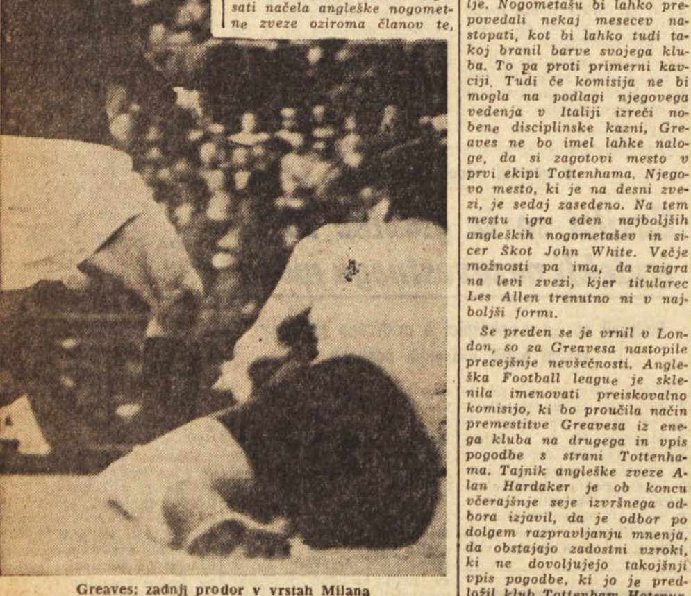
Greaves: zadnji prodor v vrstah Milana

Mnenja o Greavesu so zelo različna. Nekateri trdijo, da je treba predvsem odlo- sati načela angleške nogometne zveze oziroma članov te,