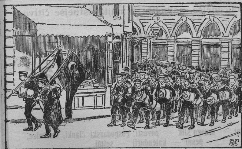
Einmarsch österr. Matrosen in Konstantinopel.

stro-ogrsko šolo ter banko. Ker je zdaj glavna nevarnost odpravljena, so odšli vojaki zopet na svoje parnike