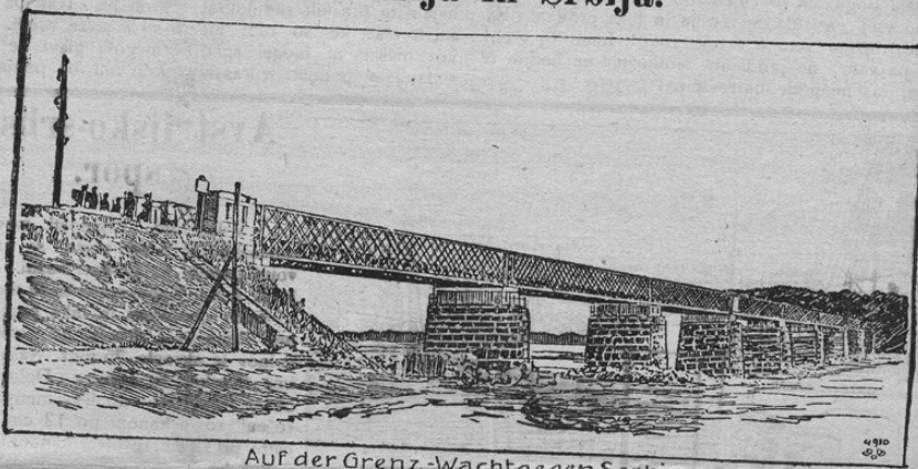
Auf der Grenz-Wacht gegen Serbien

Naša slika kaže velikanski železniški most, ki veže Avstrijsko mesto Semlin s srbsko prestolico Belgradom. Ta most bi bil seveda v vojni velike važnosti, ker je železnica Budimpešta-Semlin izrednega pomena. Srbi so hoteli baje ta most v zrak spustiti. Most je zastražen od ogrske infanterije.