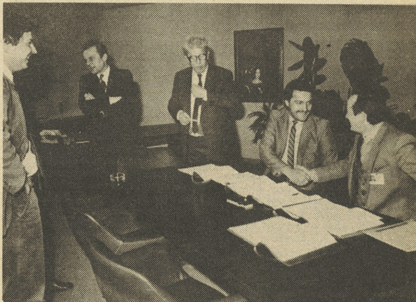
Ob podpisu samoupravnega sporazuma.

Potem ko je Interesna skupnost Jugoslavije za gospodarske stike s tujino končno le potrdila SOZD Iskra kot samostojno reprodukcijsko povezavo, so pooblaščen predstavniki Iskrinih delovnih organizacij v torek, 13. marca podpisali Samoupravni sporazum o združevanju dela in sredstev za skupni izvoz, o določitvi družbeno priznanih reprodukcijskih potreb in o razporeditvi dela dela za reprodukcijske potrebe na posamezne udeležence v Iskri.