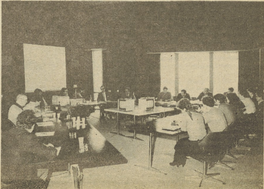
S sestanka projektne skupine DO Široka potrošnja.

meljnih organizacij Široke potrošnje) pregledamo dosedaj opravljeno delo pri uvajanju sodobnih poslovno-informacijskih (Nadaljevanje na 3. strani)