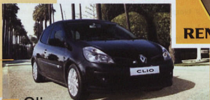
Clio - Dinamični in elegantni že za 9.290 EUR.*

*Cena velja s pogoji preko Renault financiranja.