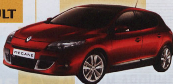
Novi Megane že od 13.900 EUR.