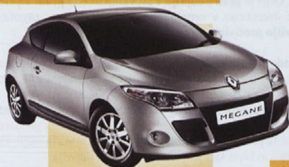
Novi Megane Coupe ŽE TUKAJ!