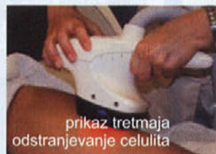
prikaz tretmaja odstranjevanje celulita

Število tretmajev je odvisno od posameznika in stopnje problema. Priporočeno je opraviti vsaj 10 tretmajev, prve spremembe pa se lahko opazijo že po treh.