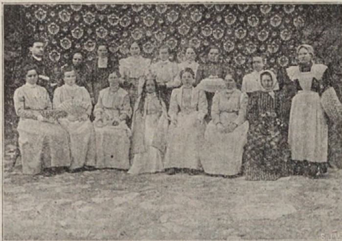
Igra: „Na Marijinem srcu.“ (Šmarje pri Jelšah.)