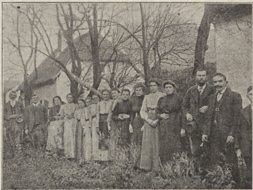
Igralci in igralke v Podsredi. Predstavljali so: Tri sestre, Dve materi, Nežika iz Bleda.

oglasila v »N. D.« iz Keblja. Pa »tak' dolgo sem upal in se bal, da upu že slovo sem dal«. Resnici na ljubo moram povedati, da je tukaj jako malo mladenk, ki bi se zanimale za narodno izobrazbo, in ako bi jih hotel naštet, bilo bi število prstov na eni roki preveč. Žalostno, pa resnično. V »N. D.« z dnem 7. jan. 1909 št. 1 se je sicer ena oglasila z obljubo, da bode, ako ne prej, vsaj ob koncu dotičnega leta vse poročala o naših mladeniških in dekliskih načrtih. Nato pa je bilo spet vse mrtvo in tudi obljuba je splavala po vodi. Toda zaradi tega ne smemo obupati nad našimi mladeniči in dekleti, ampak krepko se poprijeti dela, in trud za to bo obilno poplačan. Kakor drugod, tako bode tudi tukaj moralo poseči v mes vodstvo mladeniške in S. K. S. Z. in vspeh je zasigurjen. Sami ne premoremo nič. Kako