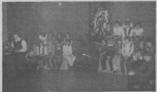
Z volilne konference občinske ZPM so poslali tovarišu Titu brzojavko z najboljšimi željami po skorajšnjem okrevanju

V okviru tega bo občinska ZPM reševala tudi probleme materialne osnove svojega dela. Pri tem se bo povezovala z občinskimi