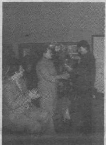
Ženo pokojnega narodnega heroja Jožeta Moškriča so tudi letos pionirji prščno pozdravili v svoji sredi

šanja iz tekmovalnega gradiva. V tem času so bila odredna tekmovanja, na katerih so dobili zmagowalce ekip.