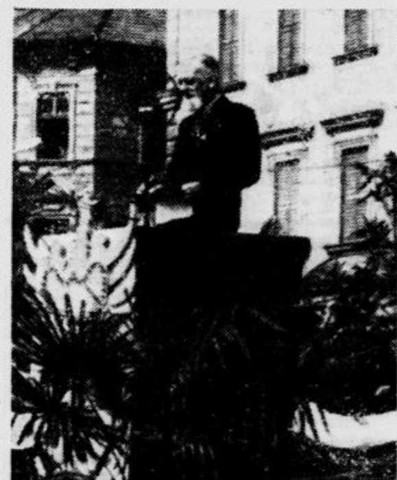
Der Präsident spricht — G. prezident med govorom

Prav malo je manjkalo, in svetovno židovstvo bi se na našem planetu z lažjo, prevaro, zlatom, knuto in streh v tlinik prigoljufalo samovlado. Saj je vendar prav posebno bele ljudi naše zemlje s svojim duhovnim sifilisom že tako razkrojilo, poneumhlo in omotilo, da bi mu človeštvo postalo v najkrajšem času povsem poslušno, če ne bi posegli vmes Previdnost in zgodovinska pravičnost.