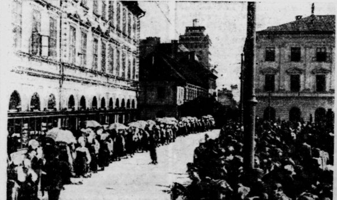
Umzug der Nationaltrachten — Poyorka narodnih noš po zborovanju