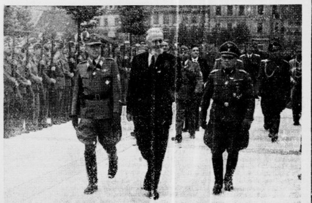
Der Präsident schreitet in Begleitung der deutschen Vertreter die Front der Ehrenkompagnie ab — G. prezident na obhodu častne čete v spremstvu nemških za stopnikov

Stopam pred Ljubljano, da slovenski prestolnici in iz nje vsem Slovincem, kjerkoli pač nosijo v svojem srcu skrb za domovino in narod, kot slovenski domobranec govorim besede domobranstva. — Govorim jih, da bi si jih slovenska prestolnica in vsi Slovenci zapomnili. Prišel bo namreč čas, ko bi bilo dobro, da bi se jih spomnili, ali pa nas bodo prilike prisilile, da se jih bomo — mogoče prepozno — morali spomniti.