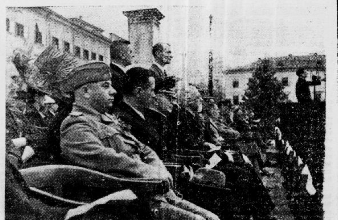
Ein Blick auf die Tribüne der Ehrenstände — Pogled na tribuno častnih gostov

koreniko, ki je vezala te ljudi s slovenskim narodom.