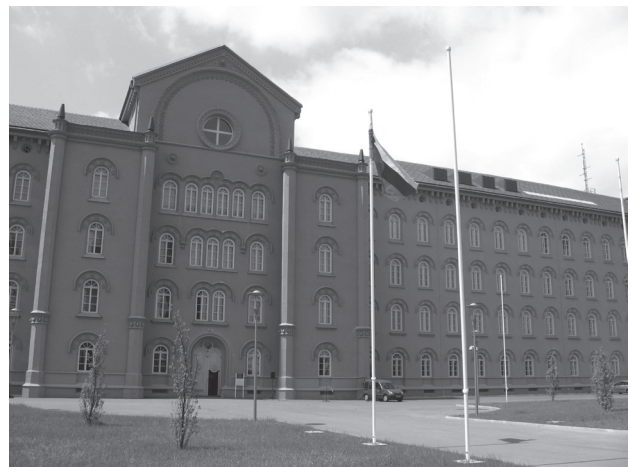
Slika 1: Obnovljena Kadetnica Maribor

Povsem novo knjižnico je dobila mariborska Kadetnica v Vojašnici generala Maistra (slika 1). Kadetnica je bila ustanovljena že pred več kot 150 leti kot ena izmed 4 kadetnic v tedanji avstro-ogrski monarhiji, ki jih je odprl cesar Franc Jožef, da bi izboljšal šolanje častnikov. Od leta 1991 je poslopje propadalo, leta 2000 pa so kadetnico začeli obnavljati. Obnova same zgradbe je bila končana jeseni 2008, v letu 2009 pa so odprli Knjižnično-informacijski center (slika 2), Vojaški muzej Slovenske vojske, Šolo za častnike in Poveljniško-štabno šolo. Knjižnica in muzej sta namenjena tudi javnosti. Vojaški muzej ima v svoji zbirki muzejske predmete, arhivsko in knjižnično gradivo, likovna dela ter fotografije. Muzej hrani obsežno zbirko vojaške zgodovinske literature. Vse gradivo je vključeno v sistem Cobiss (Toplak, 2008).