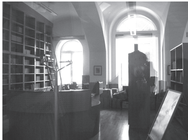
Slika 2: Nova vojaška knjižnica v Kadetnici