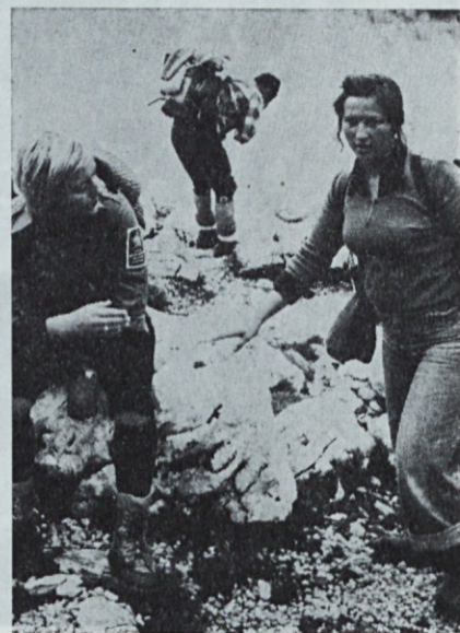
Ob prozornem jezercu