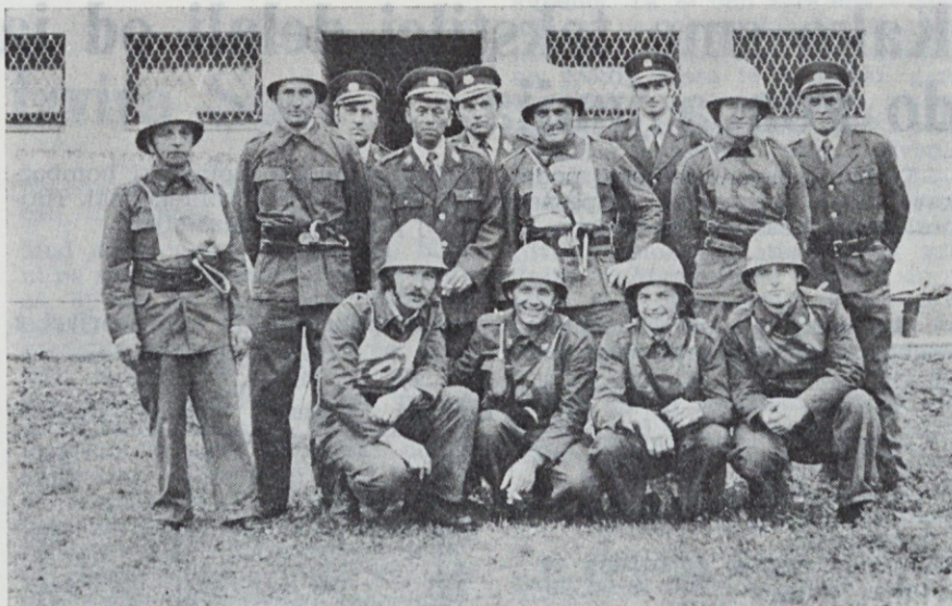
To je bila naša »odprava« v Litiji