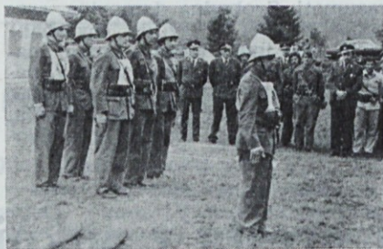
Predaja raporta tik pred nastopom