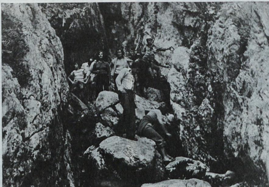
Malo truda, pa smo si ogledali še izvir Soče