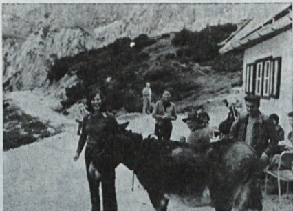
in še enkrat, prosim ...