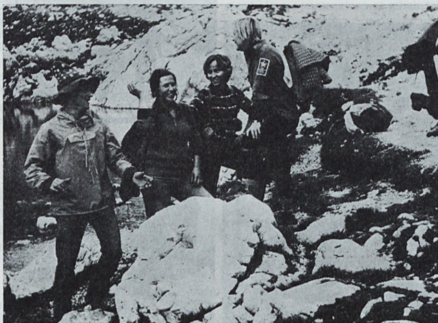
Triglavska jezera, naš nacionalni park; Oj, kako je tu lepo! Pojdite ljudje in pogledjte, taka lepota je danes že redkost