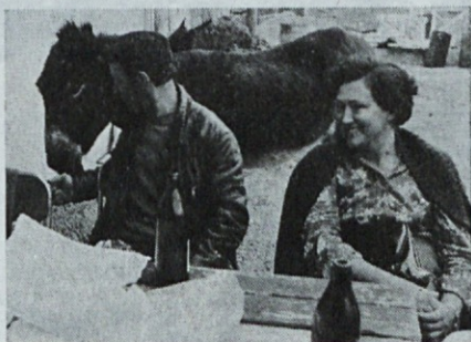
Žejni smo bili tudi — in lačni...