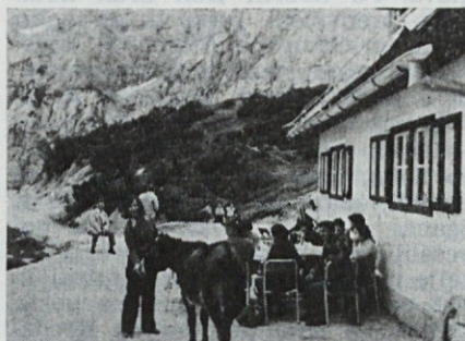
Oslček se je potrpežljivo nastavljal kameri