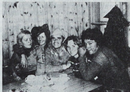
Topla kočica in prijateljstvo