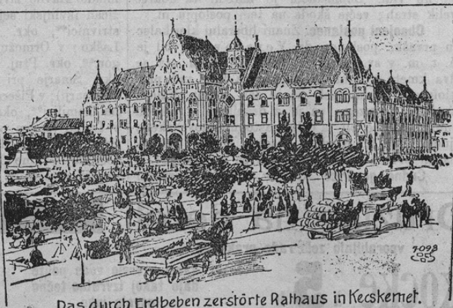
Das durch Erdbeben zerstörte Raths Haus in Kečkemet.

Že v zadnji številki smo po- ročali o hudem potresu, ki je pri- nel od ogrske pokrajine. Zlasti hudo prizadeto je bilo mesto Kečkemet. To mesto je doživelo tudi lanko potres. Pri sedanjem ni ostala nobena hiša nepoškodovana. Dim- niki so padli na ceste in v stano- vanjih se je razbilo vso pohištvo. V mestu je zavladalo seveda veli- kansko razburjenje. Mestni rotovž, lupnišče in razne šole so bili po- ročene. Piatistovski cerkev so mo- nali podreti. Telegrafi in telefoni so seveda tudi pretrgani. Škode je le v tem mestu za več milijon- nov kron. Vse cerkve in javna poslopja so morali zapreti. Dve osebi sta bili ubiti, mnogo pa jih je ranjenih. Naša silka kaže glavni vzrok potresa za rotovžem, ki je zdaj hudo poškodovan.