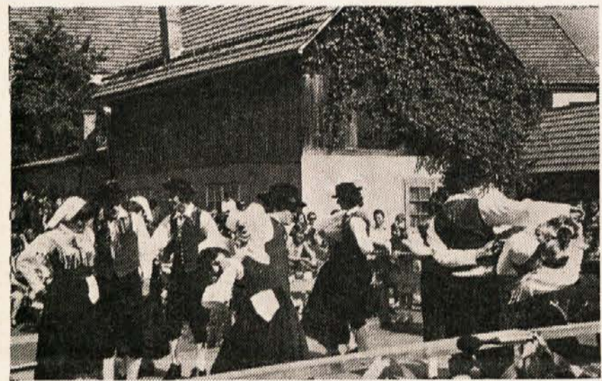
Zgoraj: množica ljudi na kraju prireditve pred hotelom Obir v Železni Kapli spodaj: ena izmed folklornih skupin — SPD „Zarja“ iz Železne Kaple