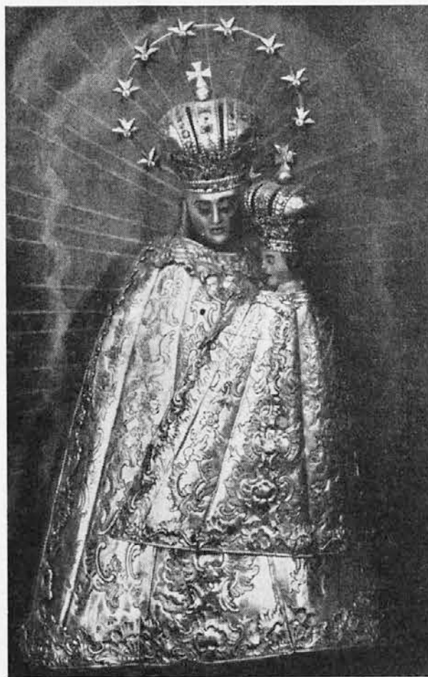
Kip višarske Matere božje

Iz statističnih podatkov Letopisa katoliške Cerkve za leto 1987 je razvidno, da se število novih duhovnih poklicev po kritični točki leta 1973 dviga predvsem zaradi večjega odziva v Afriki, Južni Ameriki in Indiji. V zahodnoevropskih državah in ZDA pa to število še vedno pada. Leta 1986 je umrlo več duhovnikov, kot je bilo posvečenih, vendar je upanje, da se bodo duhovniške vrste pomlajale.