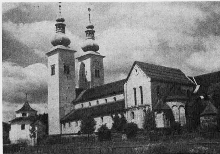
Cerkev v Krki na Koroškem, ki jo je obiskal papež Janez Pavel II. v soboto 25. junija