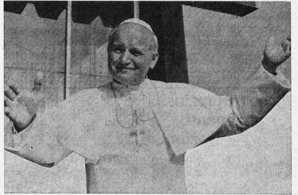
Med mašo v Krki v soboto 25. junija je papež Janez Pavel II. takole nagovoril slovenske vernike v njih materinem jeziku:

Papeža je najprej pozdravil domači škof v treh jezikih. Berili sta bili v italijanskem