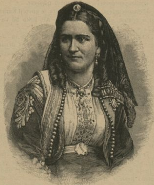
Črnogorska kneginja Milena.

svoji ženi, kakor so hladni vsi Črnogorci sploh. Posledica tega je seveda, da tudi Črnogorka ne gleda svojega moža z očmi pristrčne ljubezni, nego z očmi strahu; tudi mu ni toliko zvesta vsled prave kreposti in udanosti, marveč bolj iz strahu pred kaznijo.