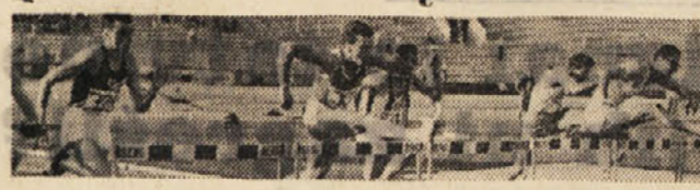
V MERANU NA JAPONSKEM