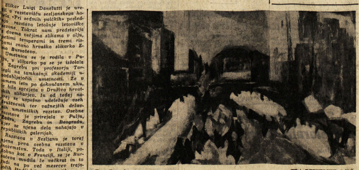
Emu Bursac: TRAJ REPUBLIKE (olje)