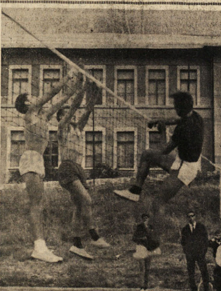
Na sliki: blok Borovih igralcev pred točeno žogo gasilcev.

Nedeljsko kolo moškega odbojarskega turnirja za pokal Furlani je Julijske Benečije ni priložnost nobenih presenečenj. Sicer je malo manjkalo, da niso Borovi igralci spravili na kolena zelo močno ekipo gasilcev, ki so bili prisiljeni v prvi igri kloniti. V drugi so se razigrali in potegnili na dan svoje najboljše krošnje - točenje, s katerim so zmedli še premalo izkušene predstavnike Borovih barv. Bolj napeto je bilo med tretjo igro, ko so imeli odbojkarji Bora, ki so gasilcem nudili oster odpor, priložnost, da tik pred koncem izenačenja in spravijo v dvom zmago tekmečev. Toda borovci so se zmedli in izgubili nekaj lahkih žog, kar je bilo usodno za končni izid.