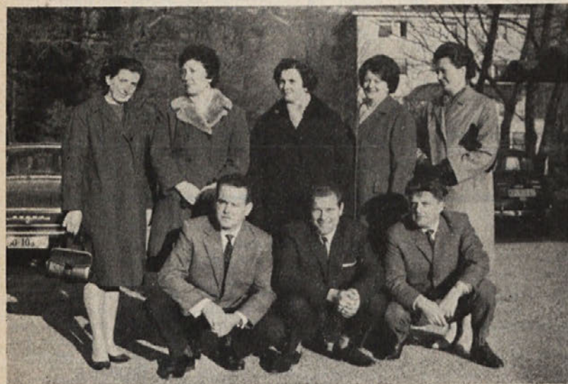
... in 15 let dela v Tekstini