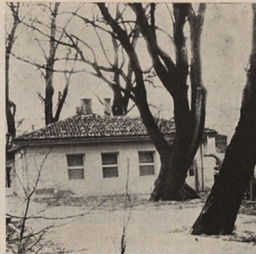
Naša »hišica zdravja« — le prepogosto ga v njej iščemo zaradi nesreč pri delu

Predlog prostih dni je sprejet po sistemu: 1 delovna in 3 proste sobote ne glede na vmesne praznike. Razpored prostih dni se tudi v nobenem primeru ne bo spreminjal, razen ene same izjeme, da bomo namesto 31. decembra delali na eno izmed prostih sobot v decembru.