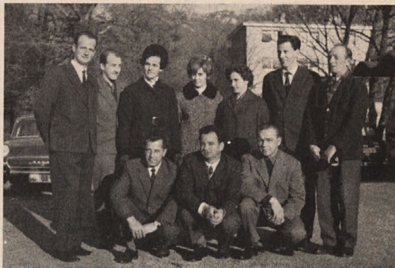
Za spomin na 10 let ...