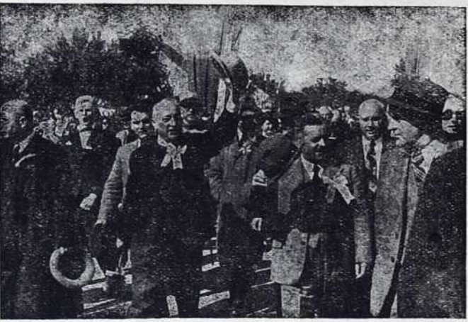
Z mladostno kretnjo in fantovskim nasmehom odzdravlja † dr. Korošec ljudstvu Slovenske Krajine na veličastnem taboru v Črensovcih.

Po balzamiranju so prenesli truplo dr. Korošca senatno dvorano. Nešteto zelenja in sveč je obkrožalo mrtvaški oder pokojnika. Pred odrom pa so bila položena številna visoka odlikovanja, ki si jih je pridobil pokojni dr. Korošec. V senatu je bilo njegovo truplo na mrtvaškem odru od sobote pa do nedelje do dveh popoldne. Ob tej uri je namreč bil pogreb v Beogradu, ko so posmrtno ostanke dr. Korošca prenesli na poseben vlak, da jih odpeljejo v Slovenijo. Krsta ima dva pokrova. Prvi je steklen, da ljudje lahko vidijo in neprodušno