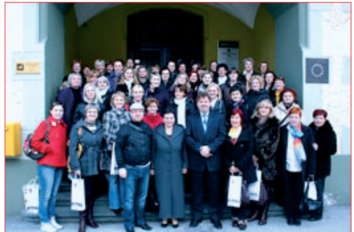
Delegacija iz varaždinskih vrtcev in gostitelji pred ptujsko Mestno hišo.

Gostje iz Varaždina so si ogledali zbirke na ptujskem gradu, nad katerimi so bili navdušeni. Sledil je kulturni program v Domu krajanov Breg-Turnišče, kjer jim je zapel ženski pevski zbor Vrtec Ptuj, vzgojiteljice so zaigrale na Orffove instrumente, za dobro vzdušje in smeh pa so poskrbele