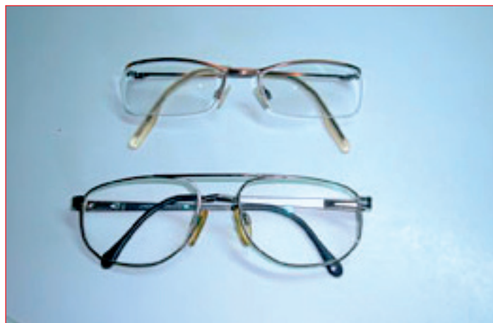
Prve izkušnje kažejo, da bomo morali, v kolikor ne bomo želeli nositi »socialnih okvirjev z debelimi stekli«, še naprej dodatno seči v lasten žep.

veljati s 1. marcem 2010. Med dobavitelje medicinsko-tehničnih pripomočkov so po novem vključeni tudi optiki, in sicer jih je bilo na razpisu izbranih 149. Zavarovane osebe bodo lahko uveljavljale pravico do pripomočka za vid na