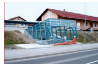
Povezava Osojnikove c. z Rogozniško.

V sklopu posodobitve železniške proge Pragersko–Ormož je bil pod železniško postajo Ptuj zgrajen podhod, ki pa ni povezoval Osojnikove ceste z Rogozniško. Na podlagi te pomanjkljivosti je Mestna občina Ptuj v drugi polovici leta 2008 v sodelovanju z Direkcijo za vodenje investicij v javno železniško infrastrukturo naročila projektno dokumentacijo za podaljšanje podhoda na železniški postaji na Ptuj. Za gradnjo podaljšanja podhoda je bilo v juniju 2009 izdano gradbeno dovoljenje. Na podlagi izvedenega postopka oddaje javnega naročila je v avgustu 2009 Cestno podjetje Maribor začelo graditi podaljšanje podhoda. Dela in vsa