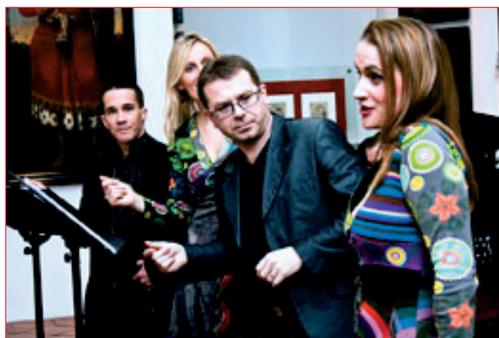
Bit Beat the Beatles - iz premiere na ptujskem gradu.

Projekt Beatlegeist destilira zimezelene skladbe legendarne in večno popularne skupine The Beatles in jih rekreira v eklektičen, klasičen, a tudi trenden zvočni koktajl z okusom opere, rokenrola in kabareta. Tako smo lahko prisluhnili največjim uspešnicam desetletja, ko je svet plesal v ritmu rokenrola. Idejno zasnovano in glasbeno vodstvo na klavirju