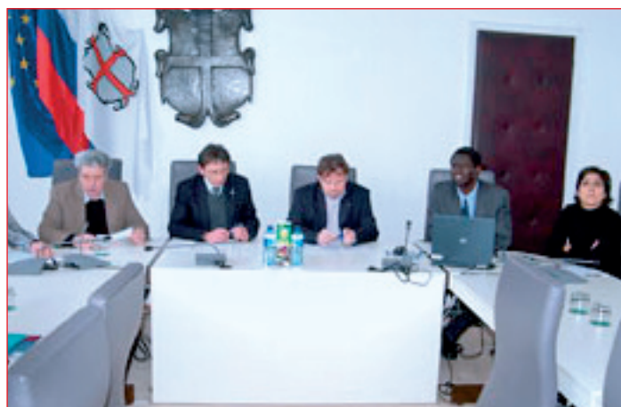
Konferenco EAPN na temo Evropsko leto boja proti revščini sta organizirala Mestna občina Ptuj in Pokrajinski ekonomsko-socialni svet Spodnjega Podravja.

3. socialno podjetništvo kot del družbene odgovornosti je lahko alternativa tržno (neo)liberalnega