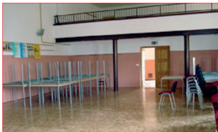
Kulturna dvorana po izvedeni adaptaciji.

V letu 2010 smo nadaljevali (glede na finančne zmožnosti) s sanacijskimi deli v dvorani, predprostoru in sanitarijah: