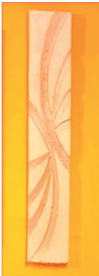
Eden izmed 22 razstavljenih reliefov v CID-u.

»Tokratna razstava je nekako nadaljevanje predlanskega ustvarjalnega ciklusa, s to razliko, da se tokrat izražam v enem samem materialu, medtem ko pa je bilo na lanski razstavi opazno izražanje v različnih materialih (les, mavec in glina). Tokrat sem se prvič odločil za tehniko reliefa v mavcu, ki pa ga je bilo potrebno predhodno tehnološko pripraviti in vlti v določene kalupe, v katerih se mavec posuši,« je o svoji tokratni razstavi povedal Samastur, ki piše tudi pesmi. Eno izmed njih je na otvoritvi razstave prebrala Nevenka Gerl, strokovna sodelavka v CIDU.