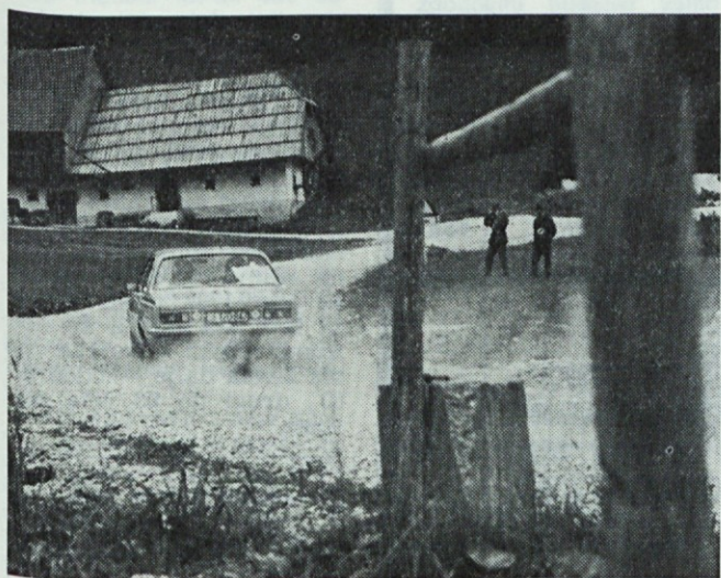
Opel kadett tovariša S. Černigoja na rally Škofja Loka za državno in republiško prvenstvo