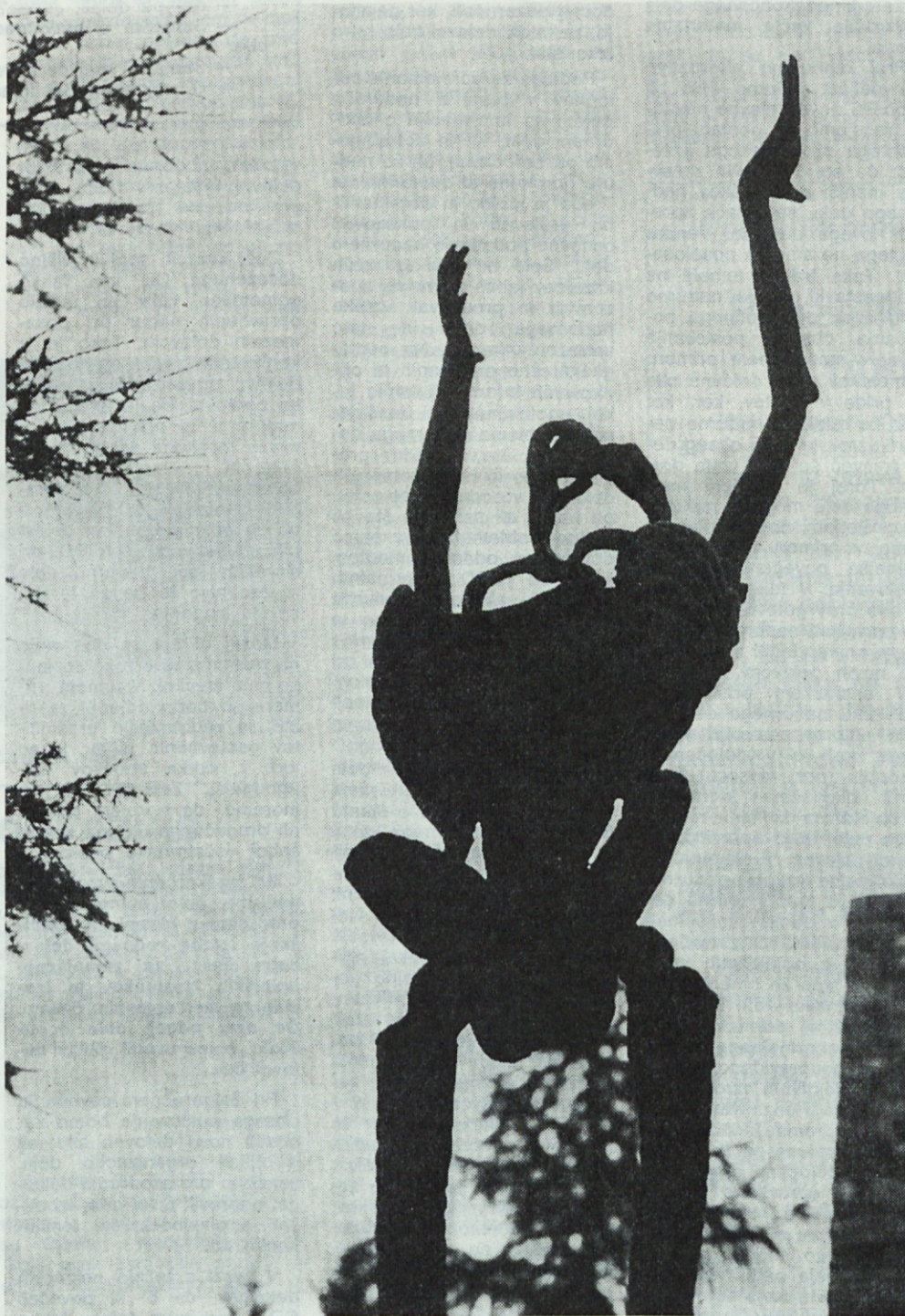
Spomenik žrtvam na Ljubelju

Te dni bomo na grobove ubitih, mučenih in padlih med narodno-osvobodilnim bojem položili morda le majhen cvet ali bogat šopek cvetic, morda bo prisotna samo tišina spoštovanja ali pa častna salva v njihov spomin. Vse to pa na tak dan govori: Ne bomo jih pozabili. Njih, ki so umrli že pred več kot tridesetimi leti, pa kot da so živi še danes. Zadolžili so nas in to nam je kot pobuda, da naš jutrašnji dan ne sme biti enak včerajšnjemu, ki ga je barvala kri in krojilo trpljenje, lakota in smrt. Ti, ki so tako umrli, nas opozarjajo, da to, proti čemur so se borili, še živi. Ne samo v južni Ameriki, na jugu Afrike in še kje, temveč tukaj, čisto blizu, na avstrijskem Koroškem. Množice ljudi se bodo na praznik mrtvih poklonile žrtvam po vsej Sloveniji in tudi v zamejstvu, še več pa jih bo, ki bodo sami ali v krogu najbližjih stopili na grobove svojih dragih, da bi bili tega jesenskega dne sami z njimi.