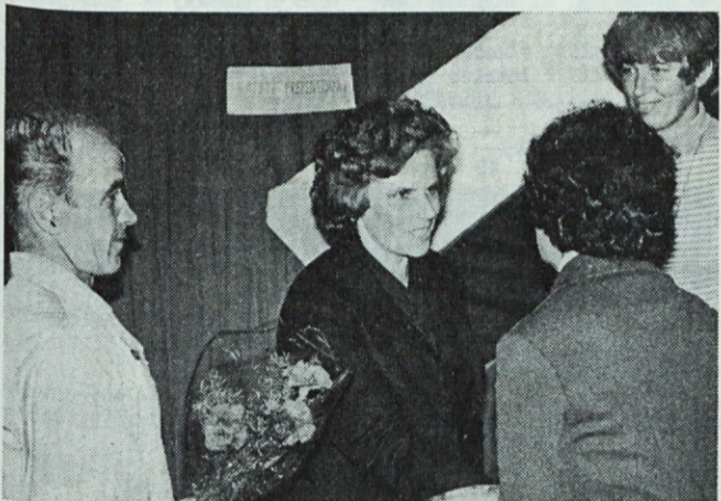
Tudi drugi so sprejemali čestitke in darila