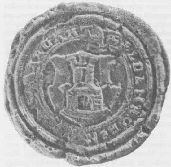
Pečat trga Vuzenice iz druge polovice 16. stoletja