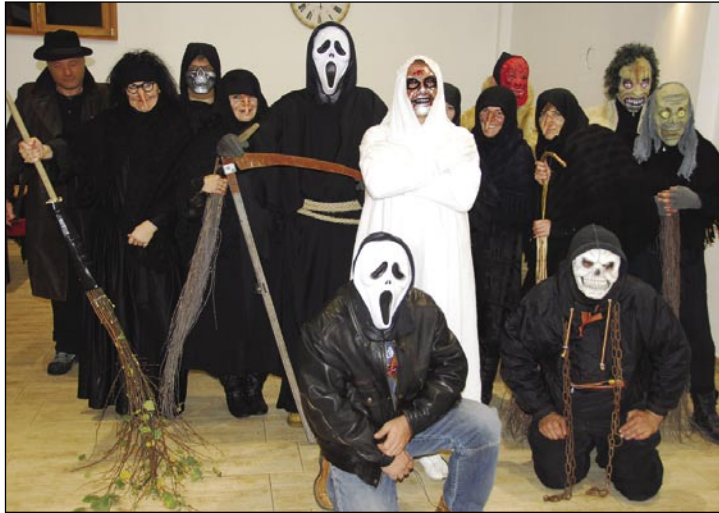
Brezi članov andovskega društva pohod ne bi biu tak »strašljivi«

pa cejlo nauč z njimi pleso ali kak je smrt vido, so največkrat pripovedjali, gda so goškice ali kukarce lőpali... Po tej uvodni besedaj predsednika smo se mi tő napautili