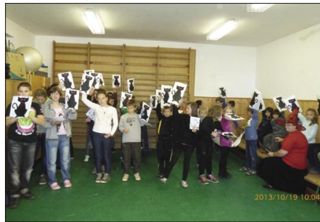
Če so že čarovnice, morajo biti tudi črne mačke

Na koncu se je v naravi vse pomešalo: drevesa in plodovi. Učenci so jih morali pravilno postaviti.