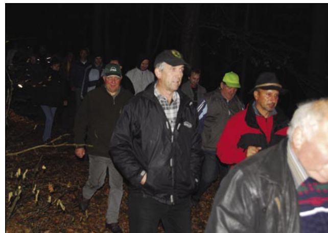
V gauški so se pohodniki vkūpdržali, ka ne bi se stoj zgūbo v kmici

nazaj na pravo paut najšli, da sta nas dveje grdi čalarice steli spraviti z nje. Nej dugo po tistim eške prva kak bi v bődinski hatar prišli, smo pá nikše čūden glas čūli. Kak gda so kosci koso brūsili, samo ka so tau nej kosci bili, liki smrt z velko kosauv. Kak je Karči Ho-