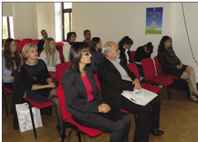
V Golarjevi hiši so razpravljali o narodnostnem pouku in učenju slovenskega jezika na avstrijskem Štajerskem, v Porabju in na Hrvaškem.