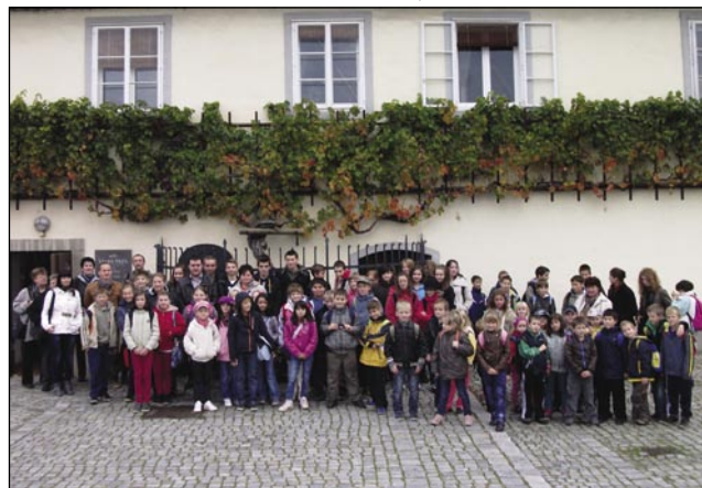
Učenci in učitelji pri stari trti v Mariboru

na ogled Maribora. Maribor je drugo najpomembnejše mesto v Sloveniji, razprostira se pod zelenim Pohorjem na obeh bregovih Drave. Imeli smo lep sončen dan. Turistični