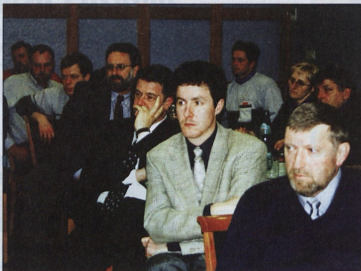
Udeleženci posvetovanja so menili, da ima Slovenija ugodne možnosti za razvoj lesarstva.

Slovenska lesna industrija ima za slovensko gospodarstvo glede na število zaposlenih, realizacijo in bruto dodano vrednost dvakrat večji pomen, kot jo ima ta dejavnost za gospodarstvo EU. Najbolj je v Sloveniji razvito stavbno mizarstvo, sledi pa proizvodnja drugega pohištva. V primerjavi z drugimi industrijskimi panogami pa so imeli lesarji leta 1999 največjo izgubo. Višjo iz-