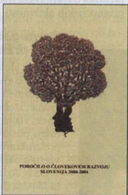
POROČILO O ČLOVEKOVEM RAZVOJU SLOVENIJA 2000-2001

ževanja. Povečan vpis pa je žal verjetno tudi posledica povečane brezposelnosti. Mladi, ki ne dobijo zaposlitve, so se v večji meri odločali za izobraževanje. Čeprav se je pričakovana življenjska doba povečala, je v primerjavi z drugimi državami zdravje v Sloveniji najslabše.