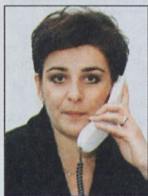
Piše: Lidija Jerkič, univ. dipl. iur.