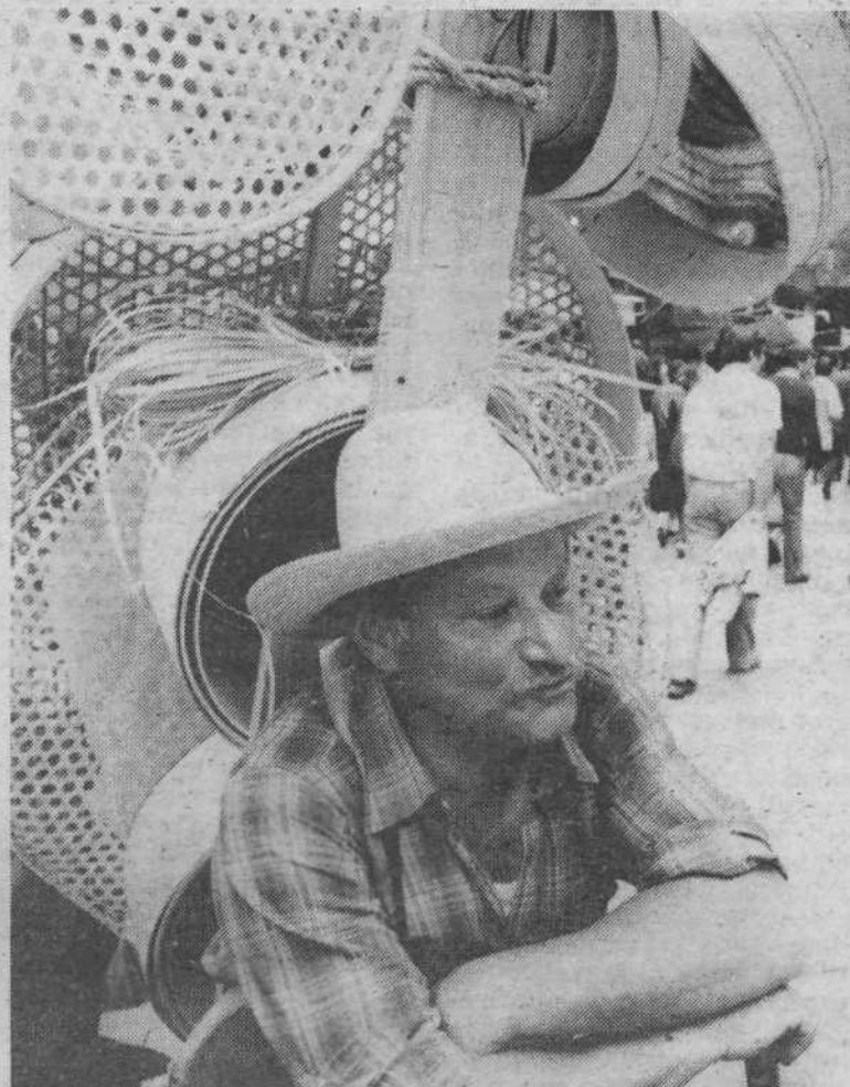
Na Ohceti že, kaj pa sicer...