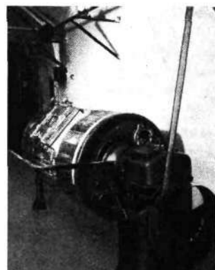
Pino-gnetilnik najnovejšega tipa. Iz pinje pride izdelano maslo

Izredno neugodne pa so ugotovitve obeh uradov v pogledu same čistosti, higijene mleka. Mleko zelo pogosto vsebuje najrazličnejšo nesnago. Oba urada sicer priporočata precejanje mleka takoj po molži, vendar se, kakor se razvidi iz napravljenih preiskav, vse premalo pozornosti posveča čistosti pri molži. Prav redki so oni pridelovalci, ki se drže danih jim navodil. Do danes se torej žal ne vrši prav noben pregled mleka vse do samega uvoza v mesto, to je do mitnice. Znano je, da se nahajajo v mleku milijoni in milijoni bakterij. Njihovo število se da izredno omejiti s čistoto pri molži in pri posodi za prenos. Mleko pa vsebuje pogosto tudi nešteto bolezenskih klic, ki so prišle v mleko od bolnega živinčeta. Mleko takih živali je škodljivo in posebno v neprekuhanem stanju zdravju zelo nevarno. Vrenje ubija sicer te klice, toda ne popolnoma. Vse to velja še v podvojeni meri za mleko, s katerim hranimo dojenčke.