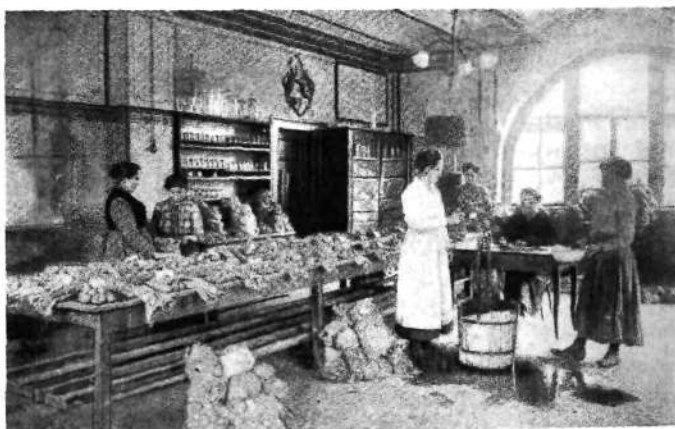
Izbiranje krompirja v laboratoriju

To delo bi v prvi vrsti obstojalo v izvedbi poizkusov o tem, katere vrste kmetijskih rastlin in katere njihove različice bi pri danih podnebnih in talnih okoliščinah najbolje uspevale na Barju, to se pravi z drugo besedo, katere bi ob najmanjših stroških za njihovo obdelovanje dale največji donos, največjo rentabilnost. Upoštevala bi se pri določitvi tega načrta že pridobljena izkustva, v kolikor so plod strokovnega izučevanja.