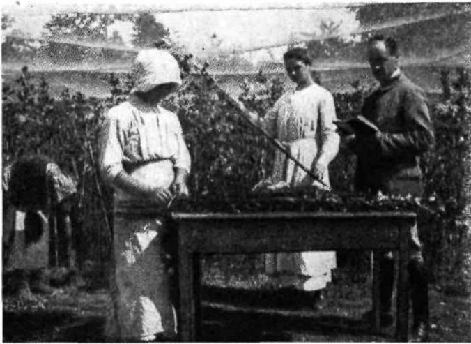
Izbiranje krompirja na vrtu

tudi Trnovo imenuje »bahata fara«. Vendar to ni morda puhla beseda. Trnovčani so ponosni na svoje delo, ponosni na svojo spretnost in na svojo umno vrtnarijo.