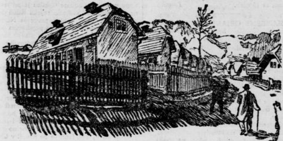
Trbovlje, 20. marca.