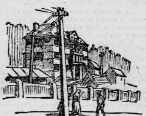
Nova bolnica bratovske skladišnice.

nič čudnega, če jih je lansko leto umrlo 199. Letos jih bo kajpak precej več, ker jih je od novega leta sem do danes umrlo že 68. V stari bolnici jih je Janj umrlo 15, bolnica pa sprejema mesečno od 100 do 120 bolnikov. Stara bolnica je zgrajena l. 1873.; takrat je bilo pri trboveljskem rudniku zaposlenih 500 delavcev, danes je njih število nad 6000! Za takratne razmere je bila bolnica jako lepo opremljena. Prostora ima za 45 postelji, mnogo se je v njej moderniziralo, a njena razdelitev je ostala primitivna in že dolgo ne zadošča več. Kmalu bo njene naloge prevzela krasna velika nova bolnica, ki se dviga na brežuliku pod loško cerkvico in ki bo skoraj dogotovljena. Okrog in okrog obdana od vrta in parka, bo nova bolnica s svojim visokim parterjem in dvema nadstropjema ter s povsem moderno ureditvijo pravi vzor - zavod, ponos Bratovske skladišnice, ki jo gradi in cele občine. V suterenu velikega poslopja se nahajajo moderno opremljena kuhinja, pralnice, likalnica in sušilnica ter naprava za centralno kurjavo ter toplo vodo, ki bo po vseh dvoranah na razpolago. Tu je tudi stan za oskrbnika in hišnika. V pritličju se nahajajo ob veliki dvorani, podobni