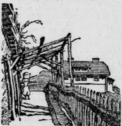
Stranski dohod h koloniji, znamenit po svoji slikovitosti.

Vse hiše so štiri-družinske; vsako stanovanje obstoja iz kuhinje, shrambe, dveh velikih sob, malga podstrešja, kleti, drvarnice in modernega zahoda. Eno sobo vsakega stanovanja nahajamo v velikem podstrešju, kamor drže odbojne stopnice iz kuhinje, kleti in drvarnice. V podzemlju je pralnica s kotelom, koritom in v dovodov, odkoder je središna kanalizacija, ki ustreza tehničnim in zdravstvenim predpisom. Vsaka hiša je stala okoli 250.000 Din. Stanovaleci, sami rudniški poduradniki in predelavci so s stanovanjem v splošnem zelo zadovoljni. Morebitni nedostatkovi skoraj ne opazimo. In če jih, nam jih takoj zabišejo lepi vrtovi, ki se razprostirajo okrog hiš in jih sedaj šele urejajo, zasajeno s sadnim drevjem in ograjajo.