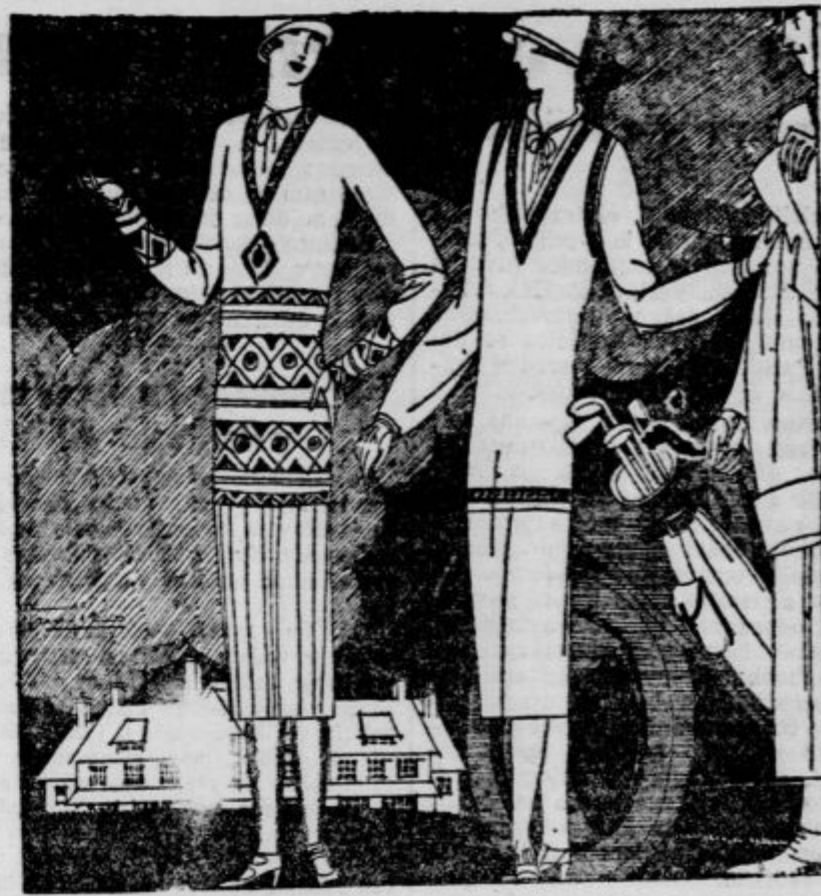
Dve pomladni promenadni obleki

— Toda moja starost... — O mlodivci, če bi izgledali stari, kar nikakor ni, bi vam še posebno povdaril, da Vas bo ravno ta frizura pomladila najmanj za petnaest let. — Bogve, ali bo mojemu možu prav? — Kaj močje! Vsi so enaki! V začetku bo tarnal oh! in ah! potem se bo pa pomiril in izprevidel, da ste storili prav. Govoril je tako spretno in prepričevalno, da mi je razpršil zadnje pomisleke in kmalu