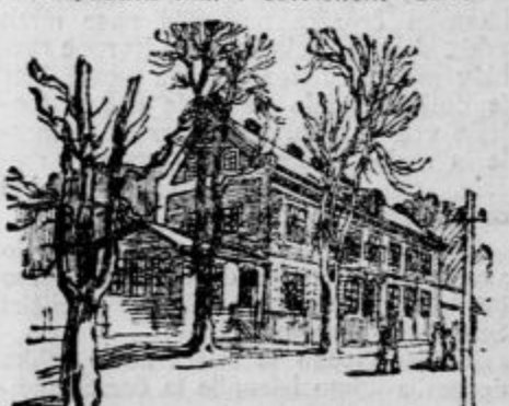
Stara bolnica bratovske skladišnice.