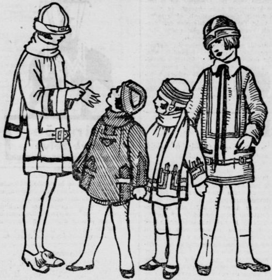
Otroške pomladanske obleke

Od leve na desno: Plašček male deklice z ovratnim šalom iz volnenega velourja v barvi surove svile z vstavljenimi rjavimi progami. — Otroški plašček