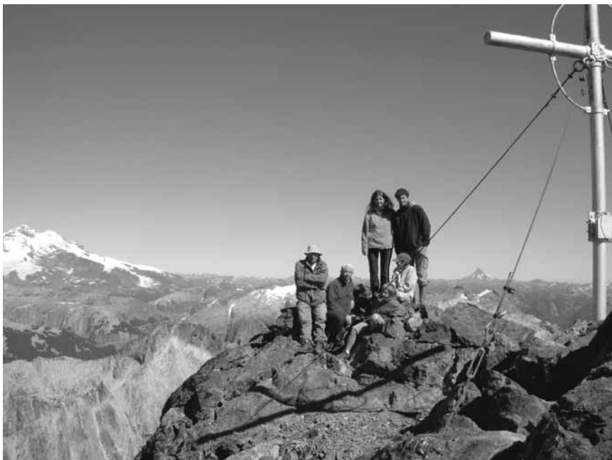
Capilla je še vedno priljubljena točka bariloških rojakov. V ozadju na levi mogočni Tronador.