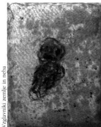
Vzglavniki zemlje in neba