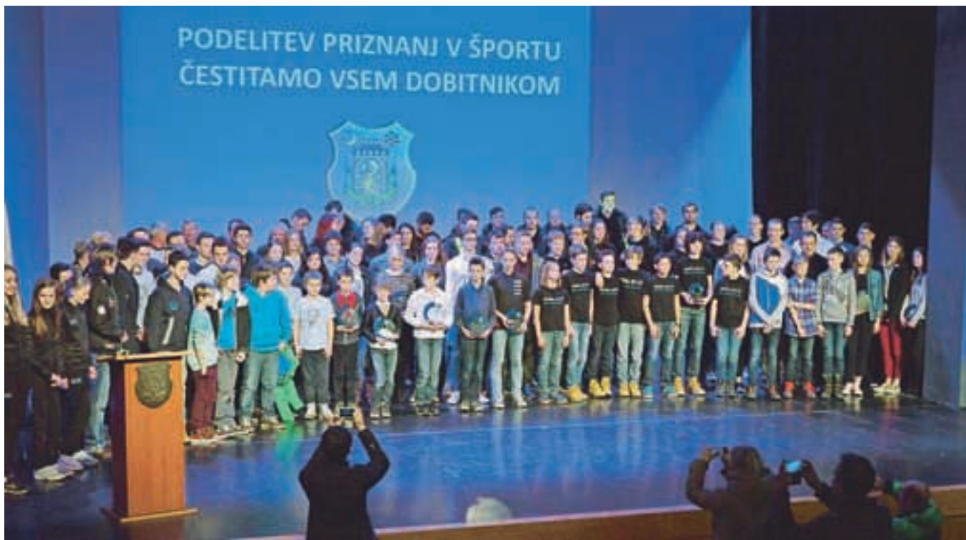
Skupinska slika najboljših športnikov občine Kamnik v minulem letu

Občina Kamnik je skupaj z Zavodom za turizem in šport v občini Kamnik tudi letos podelila priznanja najuspešnejšim športnikom minulega leta in zaslužnim delavcem v športu.