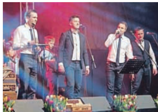
Skupina Špica