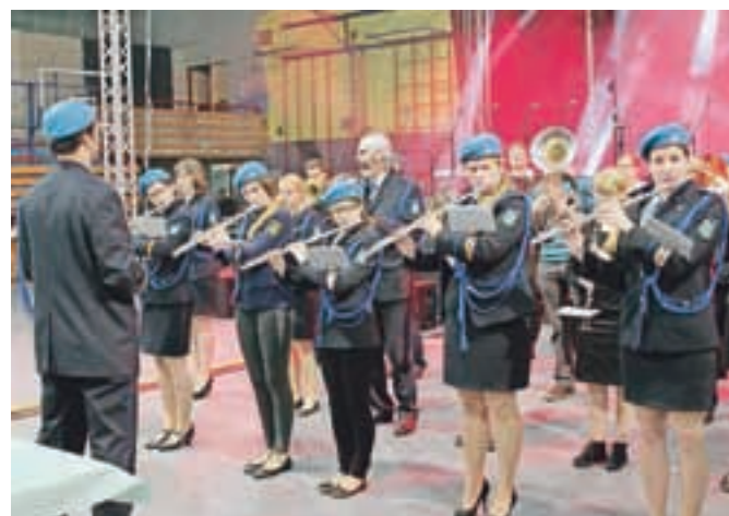
Kamniški koncert ob dnevu žena se je začel z domačimi godbeniki.

bila člana skupine Miran in Zoran še rokerja. Skladba je sedaj dobila bolj zabavno