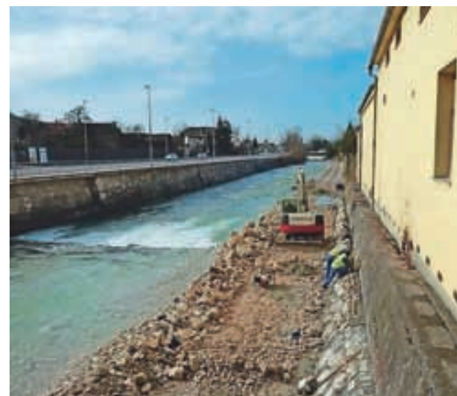
Protipoplavni ukrep zajema gradnjo in zvišanje ter sanacijo obstoječega zidu ob Kamniški Bistrici.

Dela zajemajo gradnjo novih zidov in zvišanje ter sanacijo obstoječega zidu ob Kamniški Bistrici. Kot so nam povedali na občinski upravi, delež sofinanciranja po pogodbi za Občino Kamnik znaša enajst odstotkov od vrednosti investicije, ki znaša 336 tisoč evrov. V letu 2015 so delavci opravili približno polovico del, rok za iz-