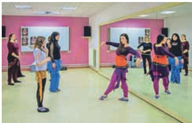
Udeležence festivala so lahko sodelovale na plesnih delavnicah.

gala večer, na katerem je na odru Doma kulture Kamnik zaplesalo skoraj sto najboljših plesalk orientalskega plesa iz Slovenije in tujine. Dvaindvajset zelo raznolikih nastopov, med njimi dve svetovno priznani učiteljici in plesalki Shereen iz Češke in Violet Scrap iz Italije, je navdušilo ljubitelje te plesne zvrsti pri nas.