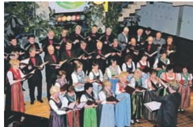
Kamniški Liraši so po letu dni znova gostovali v Trofaiachu.