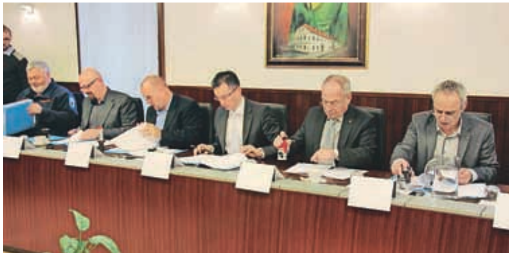
Župani pri podpisu težko pričakovanih pogodb

Kot sporočajo iz občinske uprave Občine Kamnik, ki je vodilna občina v obeh medobčinskih projektih, projekt Odvajanje in čiščenje odpadne vode na območju Domžale - Kamnik zajema naložbe v odvajanje in čiščenje odpadne vode v občinah Cerklje, Domžale, Kamnik, Komenda, Mengeš in Trzin. V okviru projekta, vrednega 39 milijonov evrov, bo zgrajena kanalizacija v skupni dolžini dobrih 47 kilometrov in 21 črpališč, nadgrajena pa bo tudi Centralna čistilna naprava Domžale - Kamnik do zmogljivosti 149 tisoč populacijskih ekvivalentov z novo biološko linijo in uvedbo terciarne stopnje čiščenja odpadne vode. K izvedbi tega projekta bo Kohezijski sklad Evropske unije prispeval slabih 24 milijonov evrov. Sedem milijonov evrov od skupno enajstih bo iz kohe-