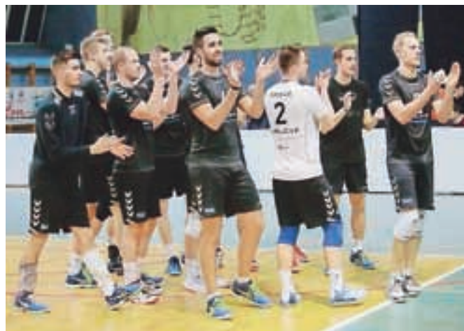
Kamniški odbojkarji danes in jutri igrajo na zaključnem turnirju srednjeevropske lige.

Prava poslastica se obeta tudi v mariborski dvorani Lukna, saj se bosta, prav tako danes, že ob 17. uri še šteti v letošnji sezoni pomerili Nova KBM Branik in odbojkarice Calcita Volleyballa. Calcitovke so zadnji medsebojni dvoboj dobile, in to v gosteh, na boleč poraz v finalu pokala Slovenije pa bodo še bolj pozabile, če bodo danes premagale bankirke, ki so jih lani premagale v finalu srednjeevropske lige. Zmagovalke tega dvoboja bodo v soboto igrale v finalu proti boljši ekipi iz madžarskega obračuna med ekipama Linmar Bekescsaba in Vasas Budimpešta.