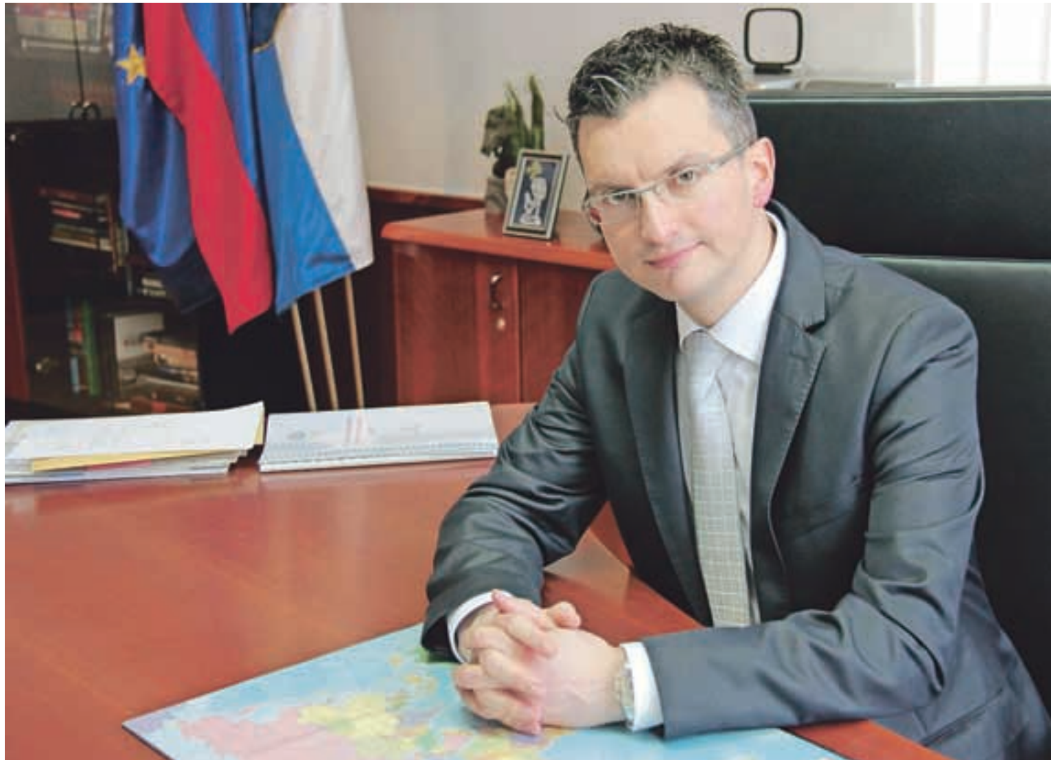
Župan Marjan Šarec

»Končno smo dobili v podpis pogodbe o sofinanciranju projektov. Po petih letih dela naše ekipe. Začetki segajo v leto 2007. Lahko si predstavljate, kakšen občutek je, ko visi na nitki 18 milijonov evrov zgolj v naši občini. Vlada Alenke Bratušek nam je omogočila začetek del z lastnimi sredstvi, kar pomeni, da smo najeli 3,8 milijona evrov posojila in zaključili dela v Tunjicah in na območju Stranj. Bilo je mnogo zapletov in usklajevanj po-