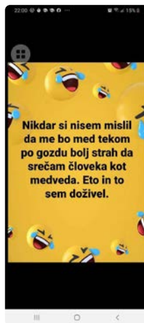
Prenos vicev po družbenih medijih (posnetek zaslona)

Leto 2020 je zaznamoval nov virus, imenovan koronavirus. Dvanajstega marca 2020 je bila razglašena epidemija nalezljive bolezni COVID-19 na območju Republike Slovenije. Med epidemijo smo se vsi znašli v novi situaciji, z različnimi omejitvami in pred različnimi izzivi. Tudi v Slovenskem etnografskem muzeju se je naše delo čez noč spremenilo. Kot družbeno odgovorna ustanova smo se vprašali, kako se odzvati in predvsem, kako v dani situaciji pomagati ljudem. Vsi oddelki so stopili skupaj in ponudili vsebine na daljavo. Na spletni strani smo odprli nov meni sem od doma , na katerem smo izpostavili vse digitalnemu svetu primerne muzejske vsebine. Poleg že obstoječih, kot so zelo bogate spletne zbirke in filmsko gradivo, smo pisali zgodbe muzejskih predmetov, zbirati smo začeli koronske zgodbe in koronske vice, saj smo bili obdani s številnimi vici, ki so krožili po različnih elektronskih poteh. Vici so se nam zdeli izjemen vir in medij za razkrivanje doživljanja vsakdanjega življenja, še bolj pa v izrednih življenjskih razmerah, ki so se nam zgodile. Njihov dnevni izbor smo začeli objavljati na naši spletni strani. 1