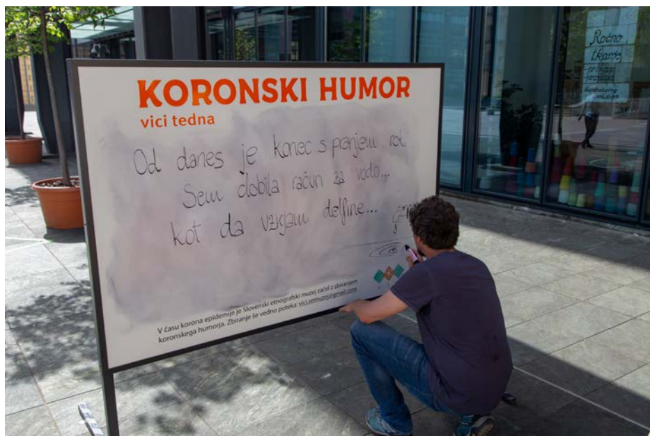
Zapisovanje vicev na panoje pred muzejem