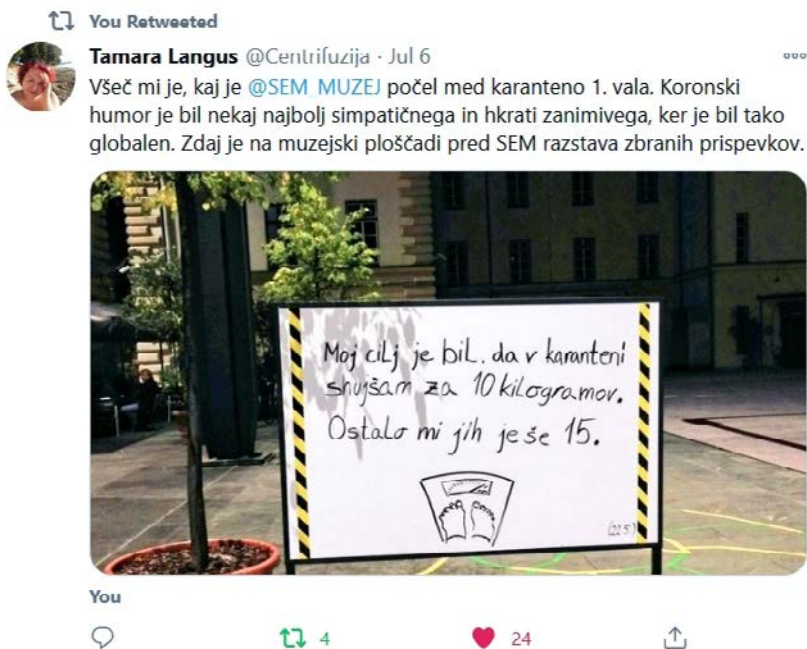
Zapis uporabnice Tamare Langus na Twitterju (posnetek zaslona)

V času epidemije se je močno povečal obisk naše spletne strani in družbenih omrežij ... Lahko rečemo, da so najbolj gledane na naši spletni strani ravno strani, povezane s koronahumorjem. Tudi na Twitterju in Facebooku smo dobili veliko pozitivnih odzivov uporabnikov. Predvsem v smislu, da ljudem vici pomagajo preživeti dan, da komaj čakajo, da lahko preberejo nov izbor. Med odzivi je bilo tudi nekaj negativnih, v smislu, da virus ni tema, o kateri se je primerno šaliti.