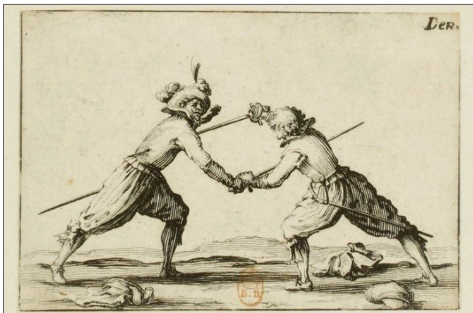
Slika 1: Prizor dvoboja iz prve polovice 17. stoletja. Jacques Callot, 1617 (Wikimedia Commons).

V obdobju cesarja Leopolda I. (vl. 1658–1705) je samo v Gradcu med letoma 1674 in 1675 izpričano dvobojevanje za tri člane rodbine Herberstein. Konec julija 1674 se je hrastovski gospod Erazem Friderik grof Herberstein zaradi prizadete časti javno dvobojeval ( daß öffentliche duell ) z Maksimilijanom baronom Stübichem. »Petelina« sta se hitro ohladila in se 2. avgusta pobotala v graškem lontovžu ( Landhaus ). 10 Ludwigova navaja, da je bil cesar preko svojih uradnikov dobro obveščen o tovrstnih konfliktih, kar se je odrazilo v celi vrsti priporov ali pridržanj dvobojevalcev. Dobra obveščenost o dvobojih vsaj od šestdesetih let 17. stoletja očitno ni predstavljala težav, saj so bili glede na komentar Gotliba grofa Windischgrätza iz leta 1664 dvoboji na Dunaju zadnji »krik mode«, s katerimi so skušali udeleženci pritegniti pozornost cesarskega dvora (!). Cilj priprtja dvobojevalcev tudi ni bil začetek sodnih procesov, pač pa v prvi vrsti poravnava med obema stranema (Ludwig, 2016, 176–177). Leta 1674 je potekal tudi dvoboj med Rihardom grofom Herbersteinom s stranske veje na Viltušu in Feliksom