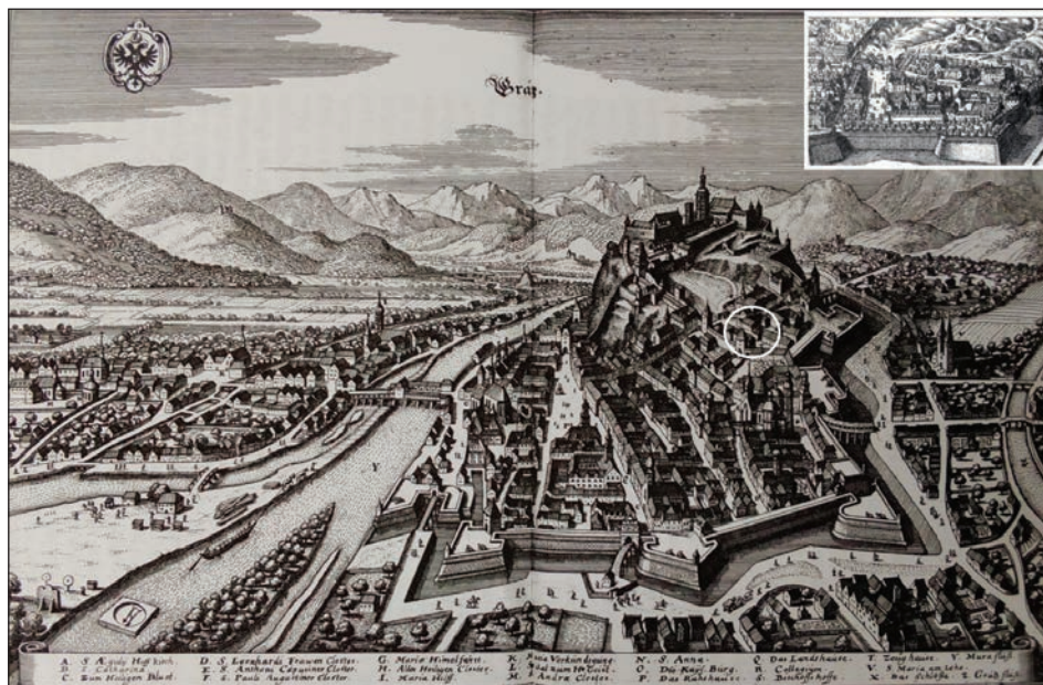
Slika 4: Merianova grafika Gradca iz sredine 17. stoletja (Merian, 1649, sl. 200) in Trostov detalj Pavlovega predmestja (Paulusvorstadt) s Karmeliterplatzom (Wikimedia Commons).

Štirinajstega februarja je svoje videnje dogodkov z 2. januarja podrobneje opisal Dizma grof Attems. V virih je gotovo mišljen Franc Dizma (1688–1750), sin Ignaca Marije, 38 cesarski komornik in svetnik notranjeavstrijske dvorne komore. Na vprašalnik s trinajstimi sklopi vprašanj je bil dolžan odgovoriti po odloku notranjeavstrijske vlade in dvorne komore. 39 Njegovo pričevanje je bilo odločilnega pomena. Od vseh vpletenih prič je edini pravilno zapisal ime pokojnega grofa Herbersteina, navedel pa je tudi ime grofa Rechberga (StLA, LR 416, H. 1, 75r). Morda je bil njegov dokaj pozen odgovor posledica poročnih priprav: zgolj ducat dni pozneje, 26. februarja, se je v Gradcu poročil z