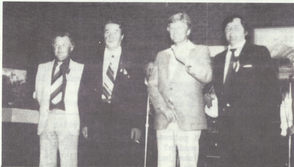
Predsedniki Slovenskih organizacij v Victoriji.