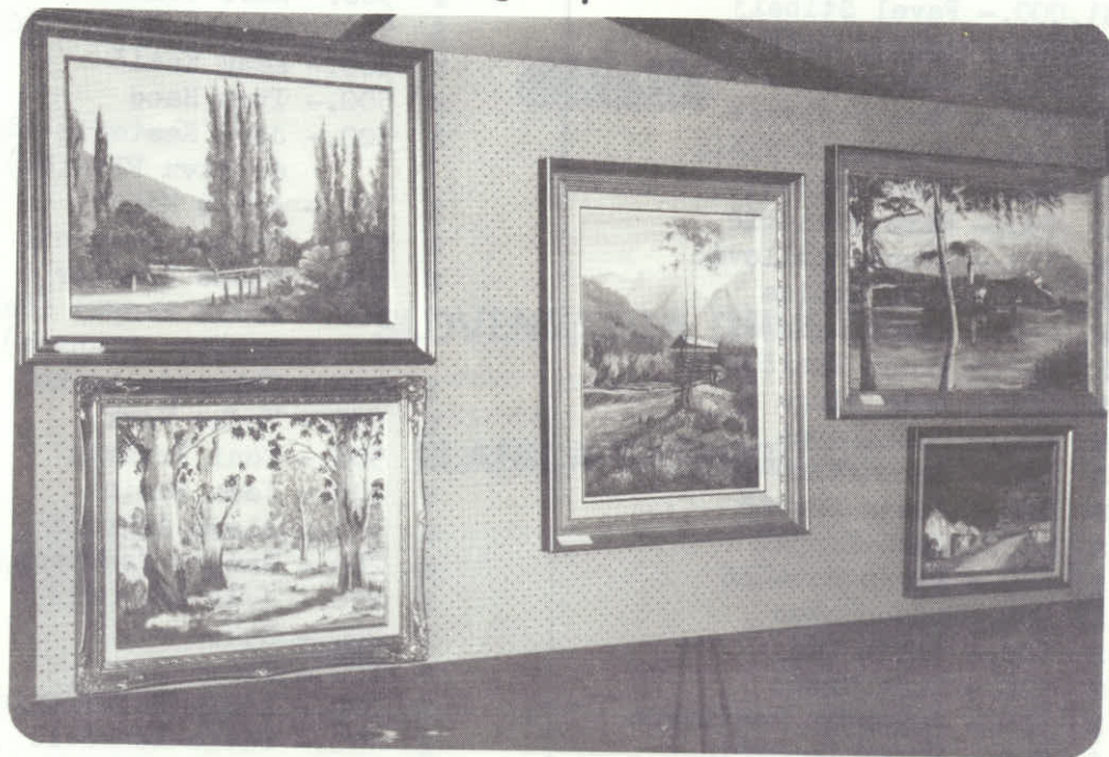
Razstava slik in ročnih del.