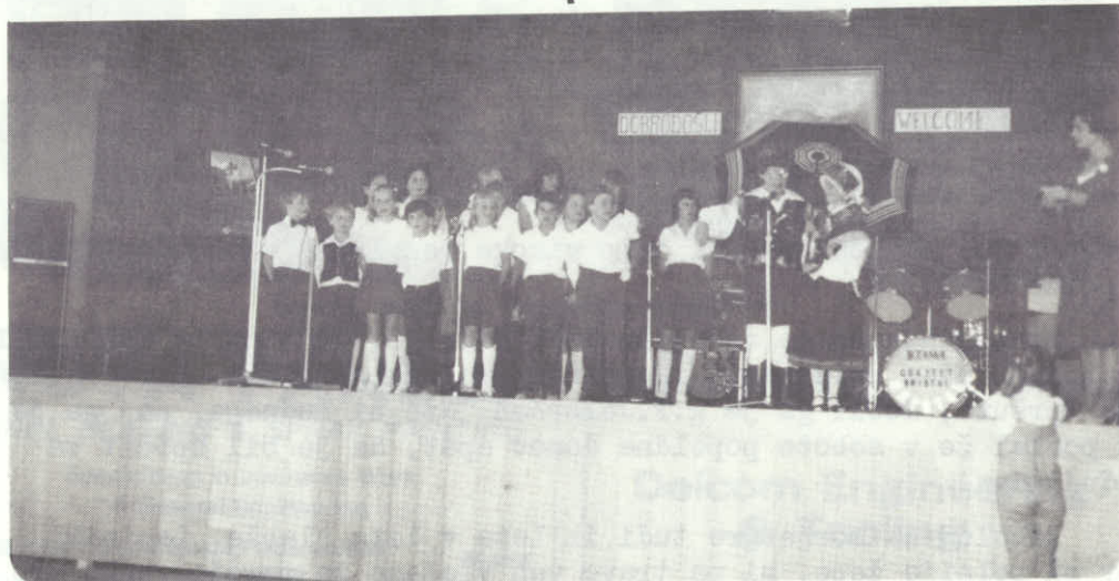
Naši najmlajši ob 10 Obletnici