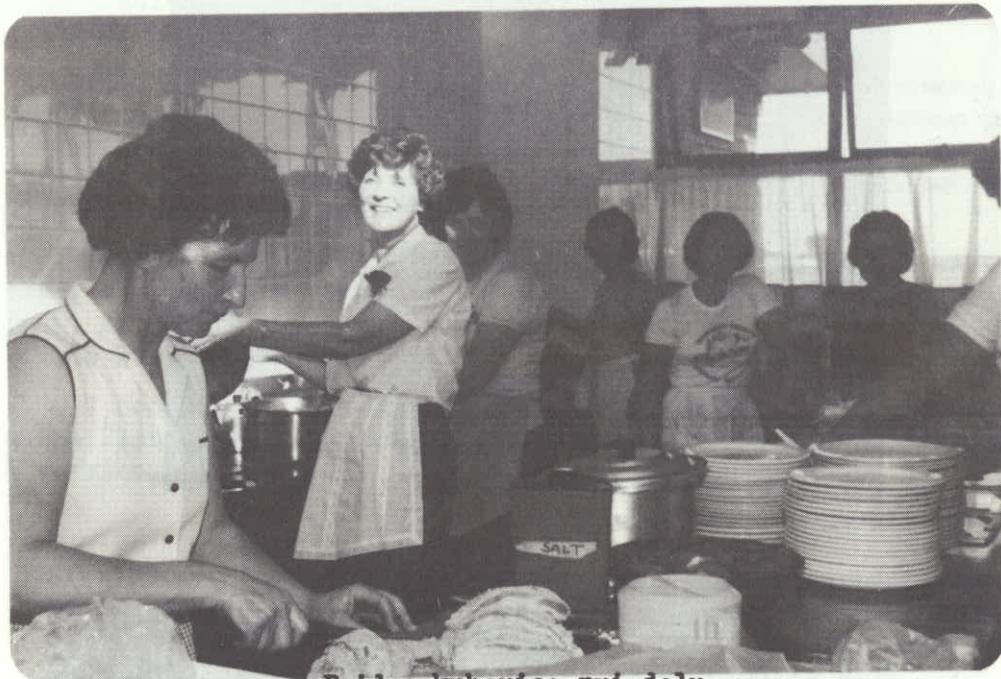
Pridne kuharice pri delu.