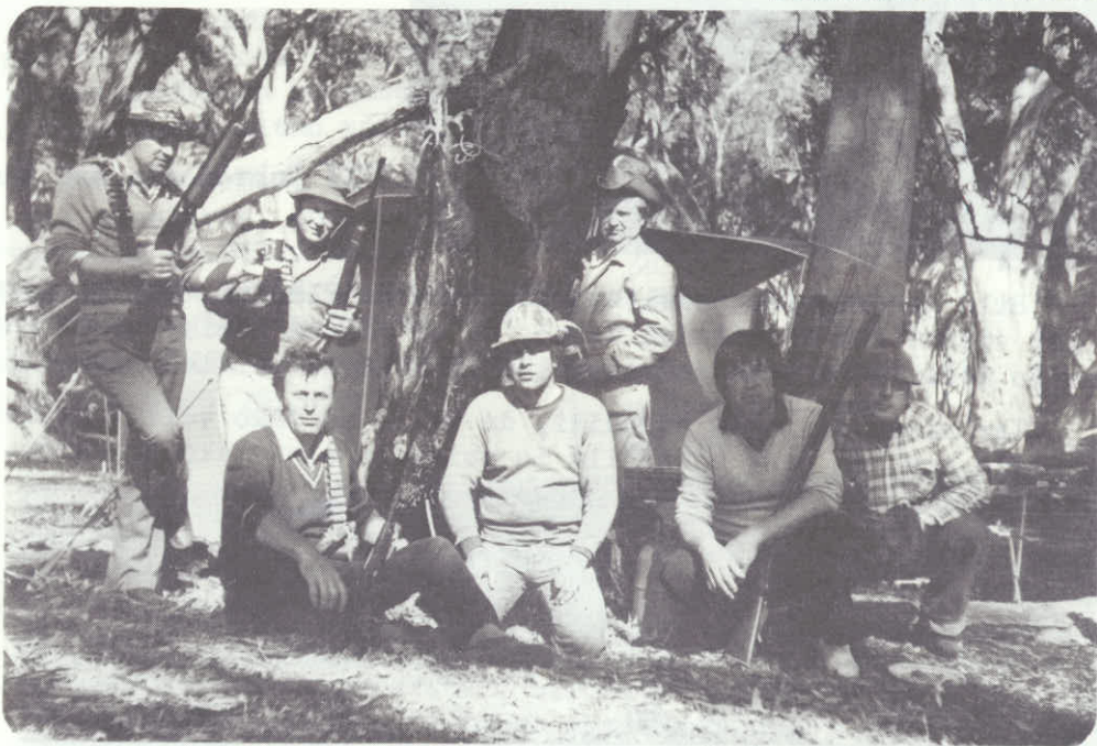
Lovci sušijo divjega prašiča