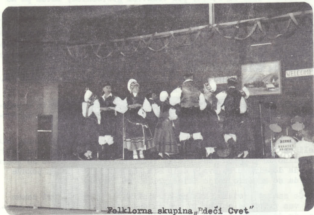
Folklorna skupina „Rdeči Cvet“