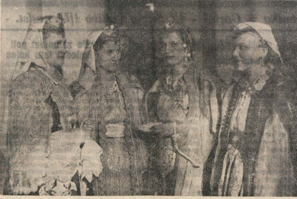
KARAKTERISTICNE NARODNE NOŠE BOSANSKIH DEKLET

Genitev števila prebivalcev za leto 1950 Na dan popisa je imela Jugoslavija 15.772.000 prebivalcev (za okrog 20 tisoč več, kakor je bilo sprva objavljeno).