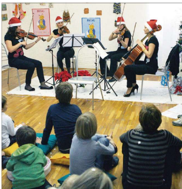
Na prvi Glasbeni sobotnici je nastopil godalni kvartet Maxima, ki ga sestavljajo glasbenice in učiteljice na različnih glasbenih šolah ter prav tako članice Orkestra Hiše kulture Celje.