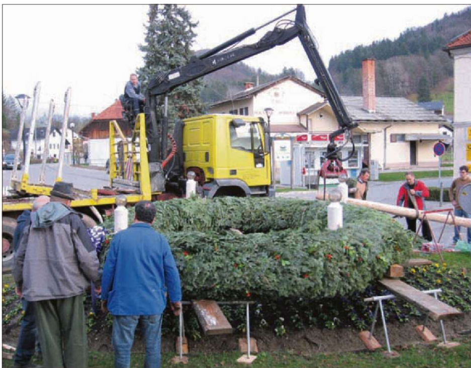
Adventni venec, ki je na glavnem križišču Dobrne, so s pomočjo tehnike hitro obesili. Ko so pred leti postavljali prvi venec ročno, je bilo zaradi mukotrpnega dela celo slišati kakšno kletvico. Župnik je ni slišal.

Po stari tradiciji pomenijo štiri sveče na adventnem vencu luč, ki jo je vernikom prinesel na svet novorojeni Jezus Kristus. Zanimivo je, da je oče prvega adventnega venca evangeličan. Evangeličanski pastor in pedagog Wichern je namreč leta 1839 v Hamburgu kot prvi okrasil leseno kolo s 23 svečami ter ga okrasil s smrečjem. Med njimi je bilo 19 rdečih, ki so pomenile delovne dni v obdobju do božiča ter štiri večje bele barve, za štiri adventne nedelje. Povod za postavitev naj bi bilo to, da so Wicherna sirote, ki je skrbel zanje, venomer vpraševale, kdaj bo končno božič. Pastor jim je to ponazoril s svečami na kolesu od kočije. Danes venec s štirimi svečami obešajo tudi v katoliških cerkvah, adventne venčke prav tako uporabljajo ateisti, ki z njimi okrasijo mizo ali vhodna vrata.