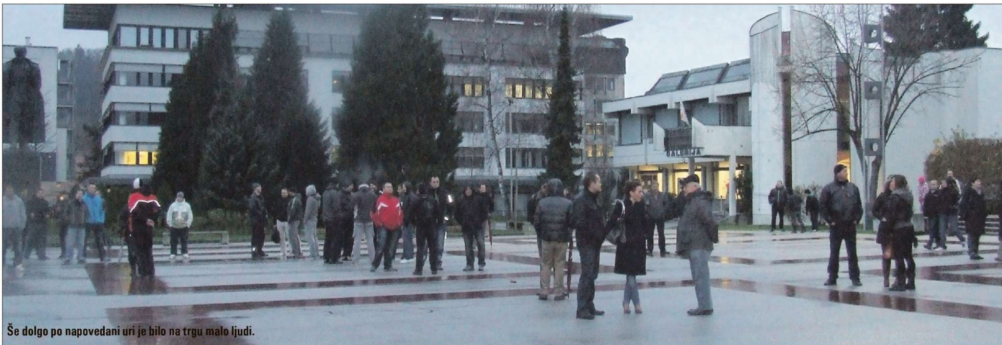
Še dolgo po napovedani uri je bilo na trgu malo ljudi.