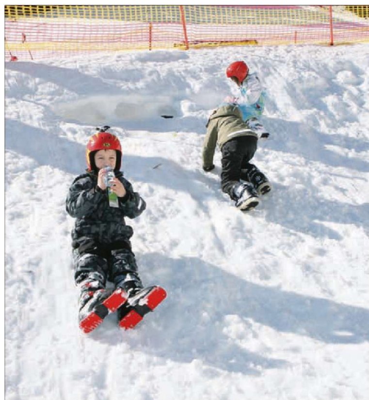
Za otroke je najbolje, da se smučanja pričnejo učiti skozi igro.