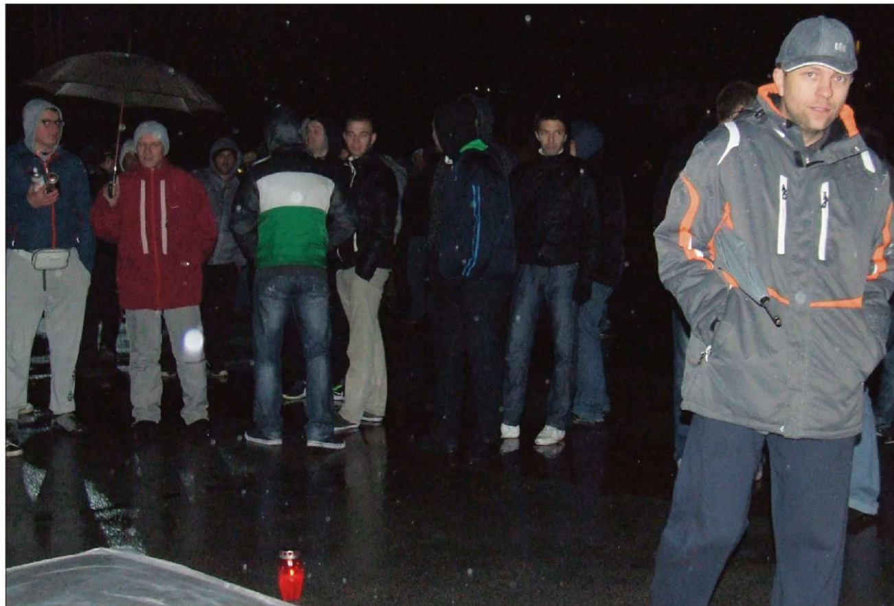
Za protestniki v Velenju je ostala sveča. Nič ni bilo slišati glasov proti lokalni oblasti, sporočilo pa je bilo v sozvočju s protestnim gibanjem po drugih krajih Slovenije, torej usmerjeno proti aktualni vladi z zahtevami za pravno državo.

Val protestov se nadaljuje – Včeraj tudi v Celju, vnovič v Mariboru, Ljubljani