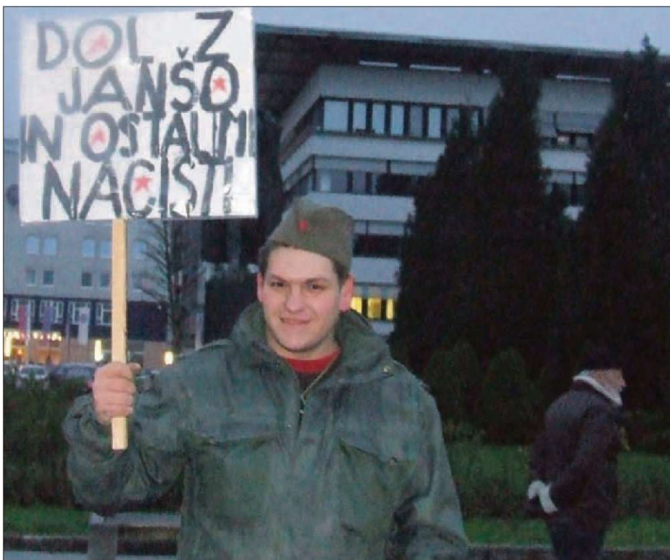
Titovka v Velenju: simbol revolucije, delavstva in kmetstva. In tudi upora.