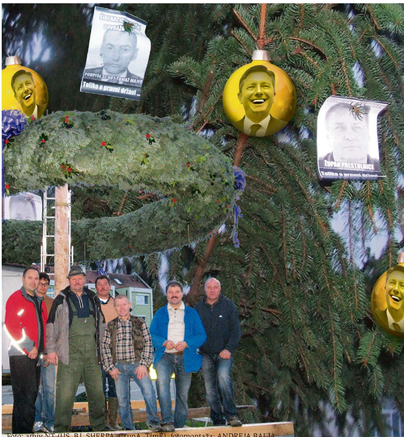
Na Dobrni smo obiskali može iz okoliškega Zavrha, ki so izdelali ogromni adventni venec.