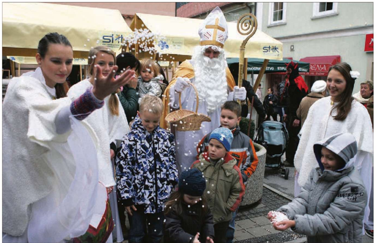
Ta konec tedna je Miklavž obiskoval stojnice in polnil vreče tudi v Laškem.

ROGAŠKA SLATINA – Miklavž je darila nakupoval