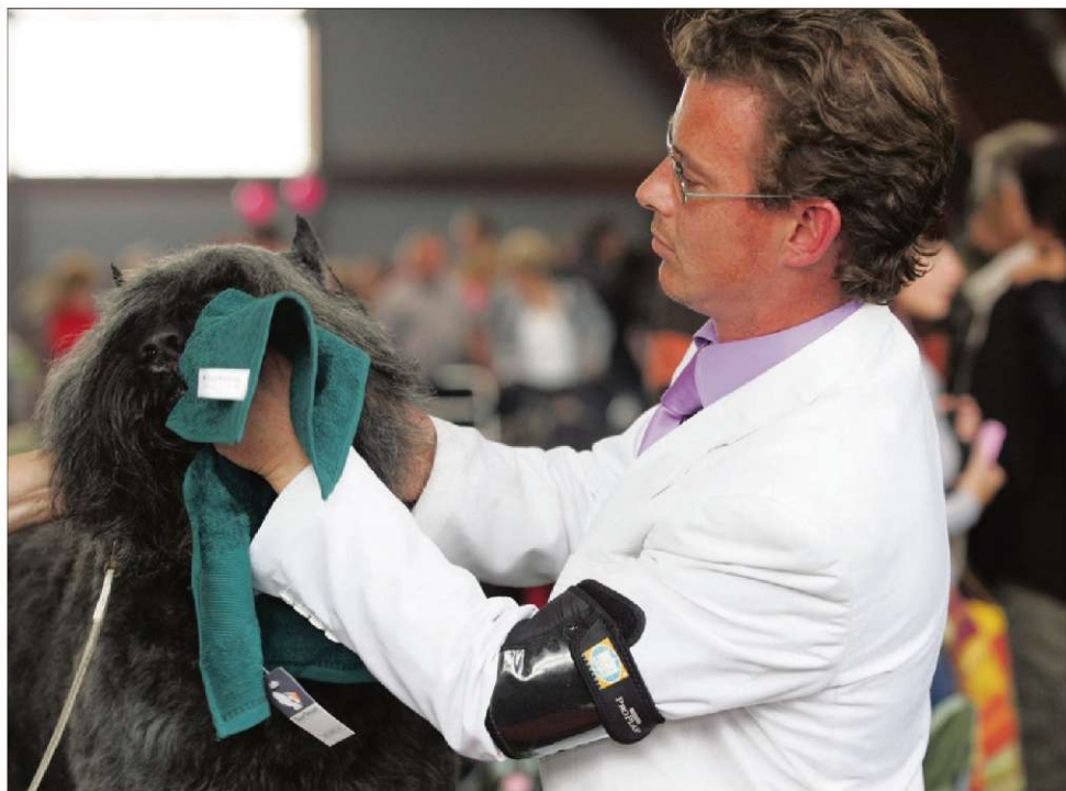
Dolgodlaki psi potrebujejo več nege, pri čemer so na voljo tudi posebej usposobljeni frizerji za živali.