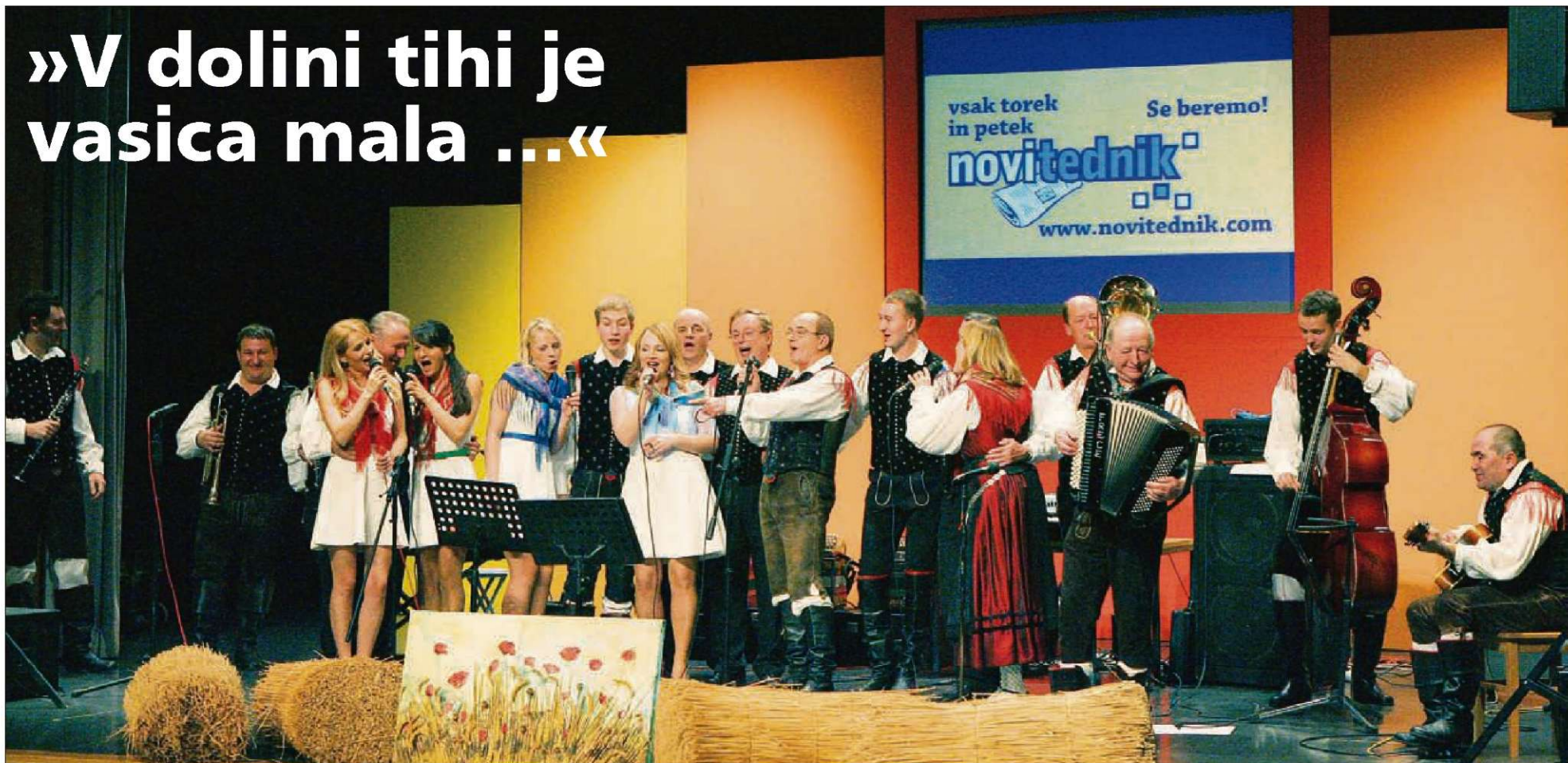
Za piko na i so združili moči Fantje s Praprotna, glasbena skupina M. J. A. V. in Savinjskih 7, ki so se ob koncu koncerta strinjali, da je bilo vzdušje v Laškem nepozabno.