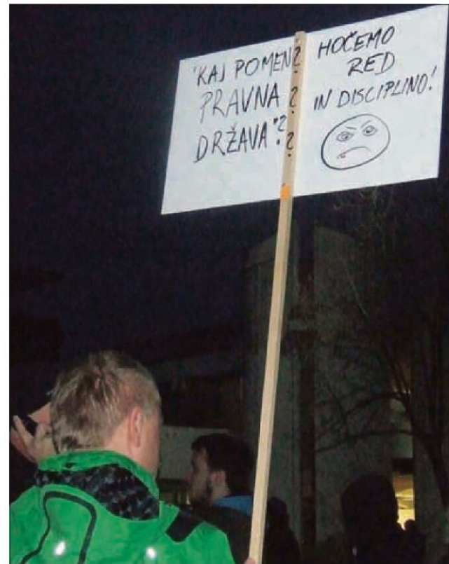
»Pravna država, kaj je že to?« je spraševala starejša gospa.