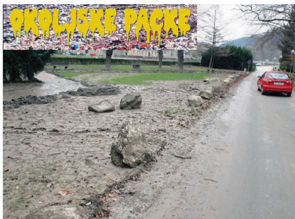
Zaradi blata oziroma mulja, ki ga je prvi novembrski ponedeljek v Mestni park nanosila Savinja, se najbolj pritožujejo vozniki, ki parkirajo na tem parkirišču.

Janez Janša, predsednik vlade, je ob čestitkah Pahorju sicer dejal, da je »prvič, odkar so v Sloveniji svobodne volitve, šel nanje zato, da glasuje proti«, ob tem pa izrazil upanje, da je Slovenija dobila predsednika republike, ki bo bolj povezovalen, ki bo sposoben inštitucije spodbujati k sodelovanju in preseganju težav. Ob tem je izrekel »zahvalo odhajajočemu predsedniku Türku za vse, kar je dobrega storil v svojem mandatu« ter opozoril, da nizka volilna udeležba ni dober znak. Politika jo mora vzeti resno in predlagati korake, ki bodo povrnili zaupanje ljudi, je poudaril ter napovedal predlog spremembe političnega sistema.