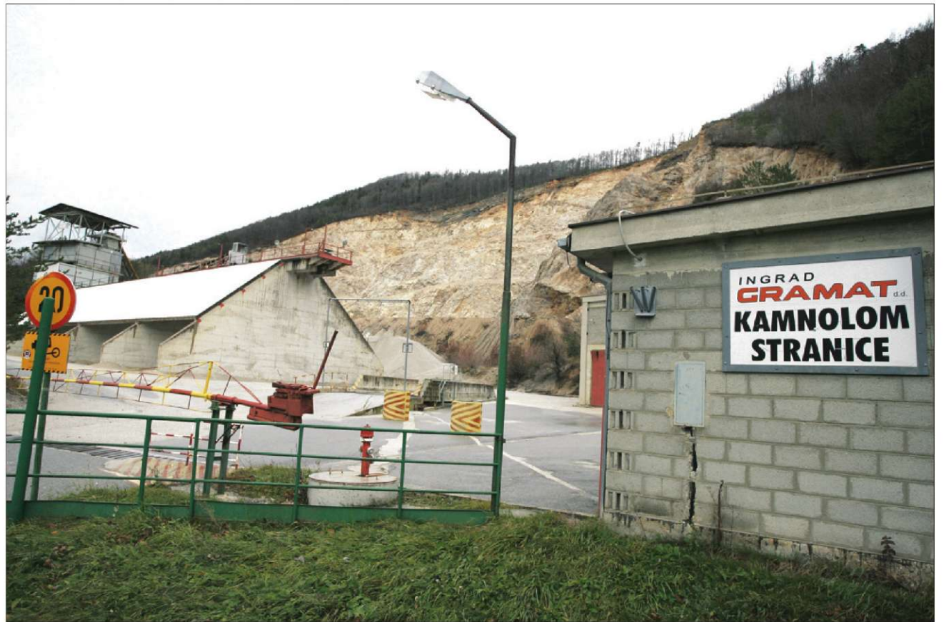
Kamnolom na Stranica, ki bo kmalu naprodaj, od blizu. Straničani si želijo zaprtje in nato sanacijo območja kamnoloma.

Za razliko od stečajnega upravitelja, ki želi kamnolom prodati, imata Občina Zreče ter Krajevna skupnost Stranice eno samo željo. Njun interes je, da bi kamnolom nehaj obratovati ter bi območje sanirali. Zaradi tega sta se Občina Zreče in KS Stranice znašli med stečajnimi upniki Ingrad Gramata, saj sta oddali zahtevek v višini več kot tri milijone