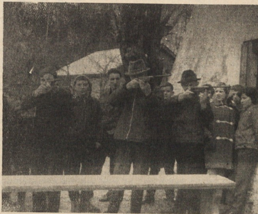
Streli v želimljah so se že večkrat dobro odrezali