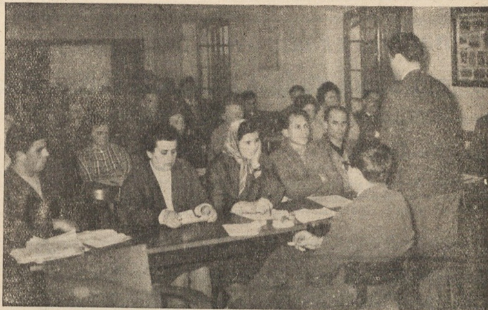
V Tobačni tovarni so priredili zanimiv seminar o delavskem samoupravljanju — O njem smo poročali že v eni izmed zadnjih izdaj našega lista

Poleg pionirskih odredov in vzgojno-varstvenih ustanov so tudi nekatera društva prijateljev mladine, skupno z ostalimi organizacijami pripravila praznovanje za najmlajše. Lepa praznovanja so bila v Kozariji, Rožni dolini, Velikih Laščah, Polhovem Gradcu, Škofljici, na Lavrici in na Igu.