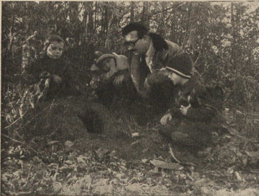
Nezavarovano mravljišče so roparice popolnoma uničile

Zakaj smo dali temu sestavku naslov: „Biološko zatiranje gozdnih škodljivcev“? S kemičnim zatiranjem škodljivca smo trenutno uničili ali omejili njegov razvoj, toda na drugi strani smo obenem uničili ali pregnali naravnega sovražnika gozdnih škodljivcev. Zaradi tega so strokovnjaki vsega sveta že pred leti pričeli proučevati koristno delovanje žuželk, ptic, mravelj, bakterij, parazitov in virusov in njihov vpliv na življenjsko, to je na biološko ravnovesje v gozdu, z namenom, da