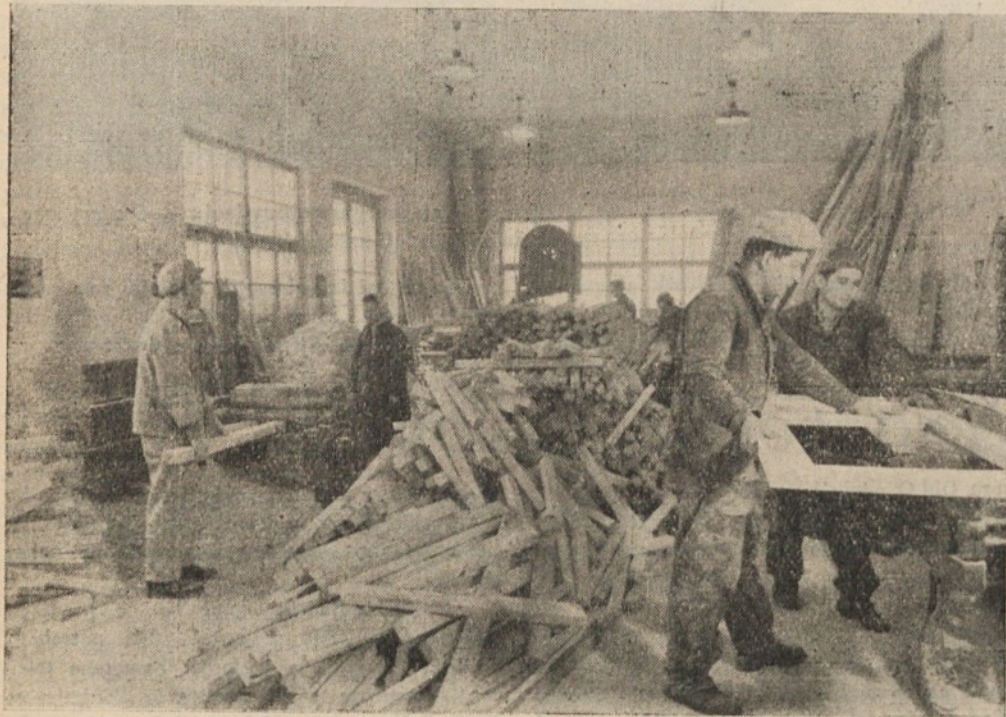
Žaga v Kozarjih je, čeprav živi v novih prostorih šele tretje leto, dosegla pri svojem delu lepe proizvodne uspehe

pravljali so še o obrtnih uslugah in potrebi po organizaciji obrtnih servisov ali njim podobnih delavnic. Precej je bilo govora o preživnini kmetov, ki oddajajo zemljo zadrugi, sami pa so za delo nesposobni in si iščejo virov za svoje življenje. Pospešiti bi veljalo čimprej še izdelavo urbanističnega načrta.