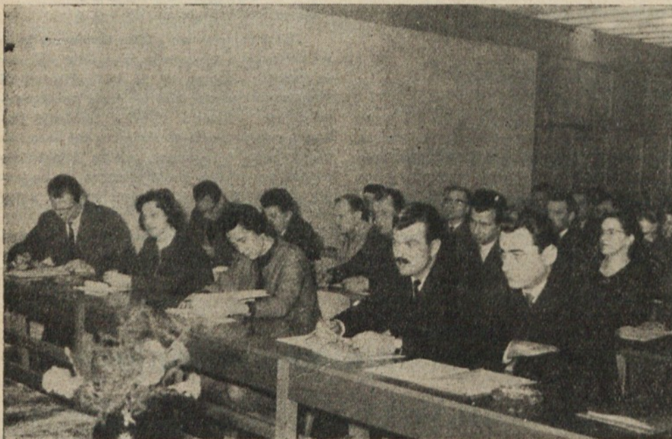
Pogled na dvorano med delom konference

Nadaljnji člen naše komunalne samouprave so krajevne skupnosti. Za ustanovitev krajevnih skupnosti morajo dati iniciativo predvsem sami prebivalci določenega kraja. Problematika v naši komuni je vsekakor zelo pestra zaradi tega, ker imamo opraviti s krajevnimi (stanovanjskimi) skupnostmi na mestnem in podeželskem območju. Po predlogu osnutka našega občinskega statuta na jbi obstojalo v naši občini 28 krajevnih skupnosti. Vse kaže, da smo pri formiranju krajevnih skupnosti preveč togo, nekako administrativno postavljali meje območjem krajevnih skupnosti ter vse premalo upoštevali potrebe in probleme, ki so skupni občanom določenega območja, ki bi jih ti uspešno reševali v krajevni skupnosti. Krajevna skupnost, ki bo obsegala del mestnega območja in del vaškega območja kot krajevna skupnost Rudnik, ne bo mogla uspešno reševati svojih problemov.