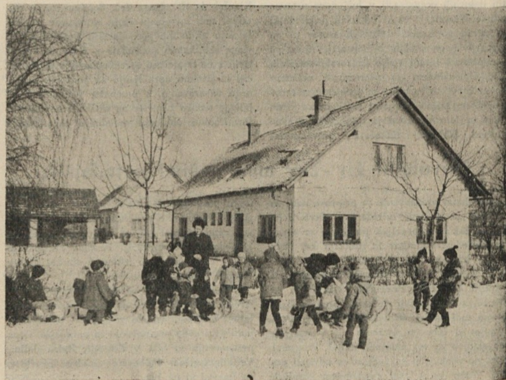
Pa smo spet prišli na svoj račun!