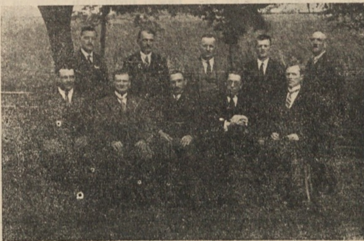
Upravni odbor Olepševalnega društva leta 1928

Olepševalna, turistična organizacija v Rožni dolini je ob svoji 60-letnici postavljena pred vrsto nalog, ki jih je nanizal naš čas. Med tem se je, seveda, urbanistična podoba Rožne doline precej spremenila. Dopolnjujejo jo pa sestavine sodobnih smotrnih stavnih potreb. Sredi prvobitnih rožnodolskih hišic so posajeni stavbni bloki; v ozadju kakor živa prizoriščna scena Inštitut za gozdno in lesno gospodar-