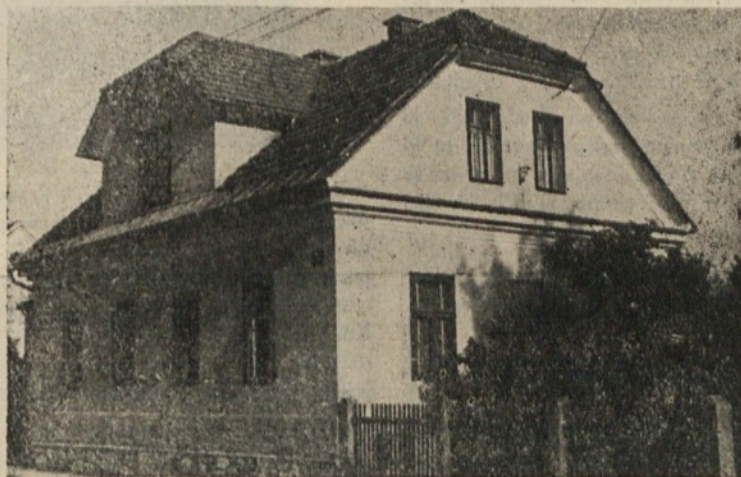
Najstarejša hiša v Rožni dolini na Cesti II.

Razen tega je zapisala Rožna dolina v letu 1952 važno pridobitev. S samopostrežno trgovino je dobila ne le svoj preskrbovalni, ampak tudi svoj urbanistični in družbeni center. V sicer mali, toda intimni kavarnici se zbirajo rožnodolski prijatelji in znanci. Obžalujemo, da ni bilo mogoče zagotoviti primerne prostora za društvene sestanke ter občne zbornice. Sedanji prostori v Levčevi ulici ne ustrezajo povsem. Preveč obrobna lega je neprimerna za prebivalce z drugega oboda Rožne doline, zlasti še, če se potapljam v nalih ali v megli.