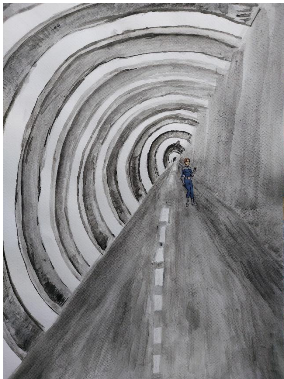
Nuša Bagari Krajnc