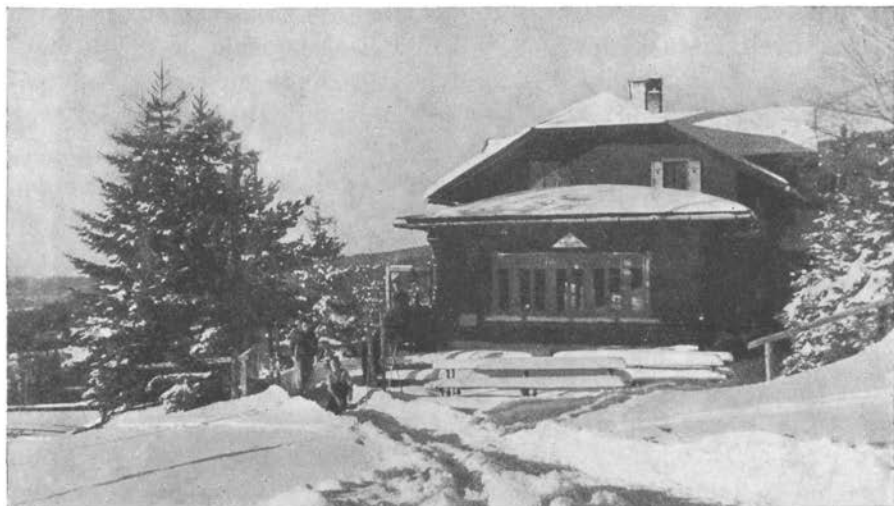
Mariborska koča na Póhorju