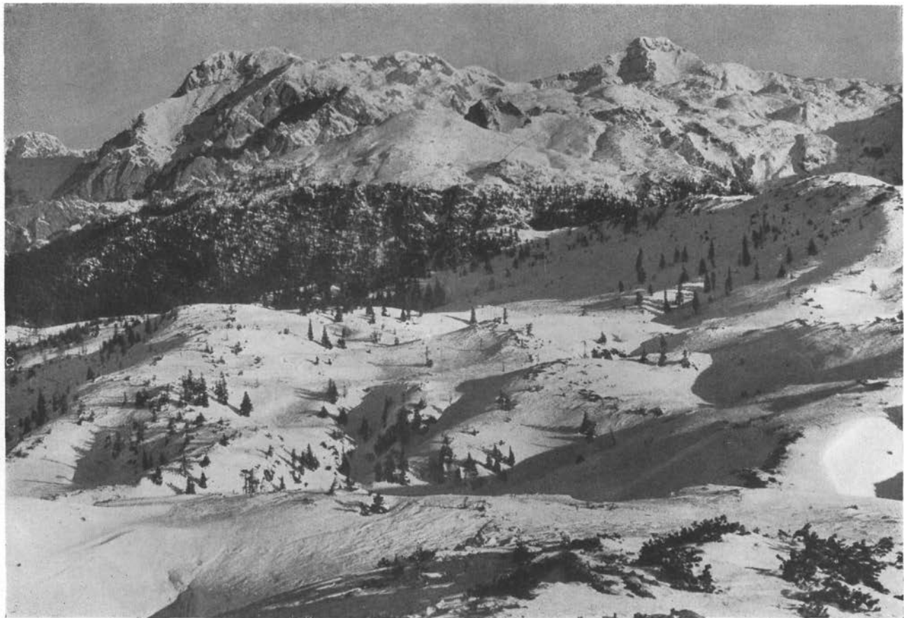
Planjava in Ojstrica z Velike Planine