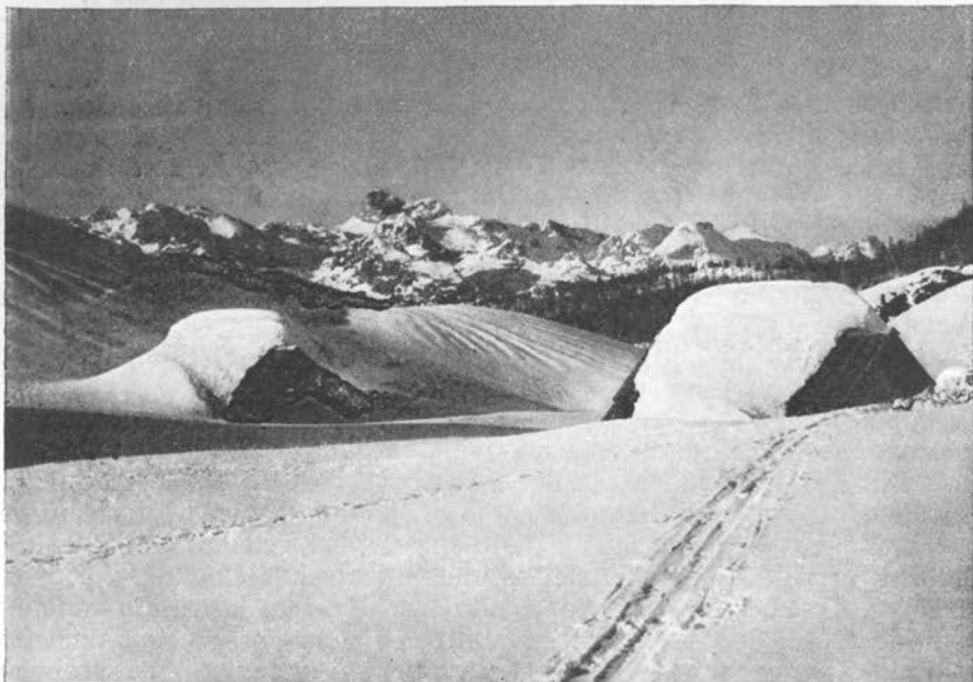
Pogled na Triglavsko pogorje z Vogla