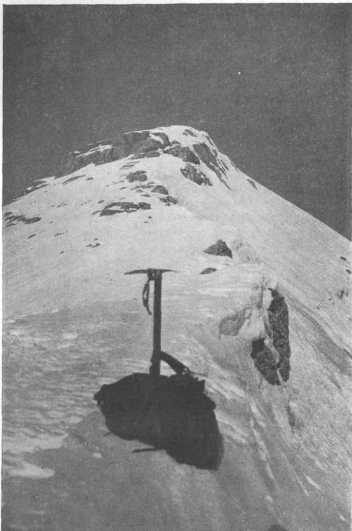
Na grebenu Vel. Draškega Vrha

Sklenila sva, da pojdeva naprej po stezi in poskusiva od jugozapadne strani prodreti na vrh. Takoj se je pokazalo, da je bila ta misel pravilna: ta plat gore je bila malone do grebena kopna.