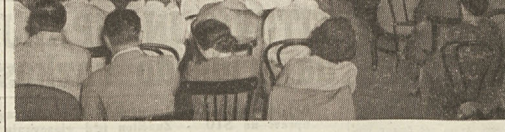
Ob priliki občnega zbora je bila prirečena v dvorani Kraljiča priloznostna knjižna razstava