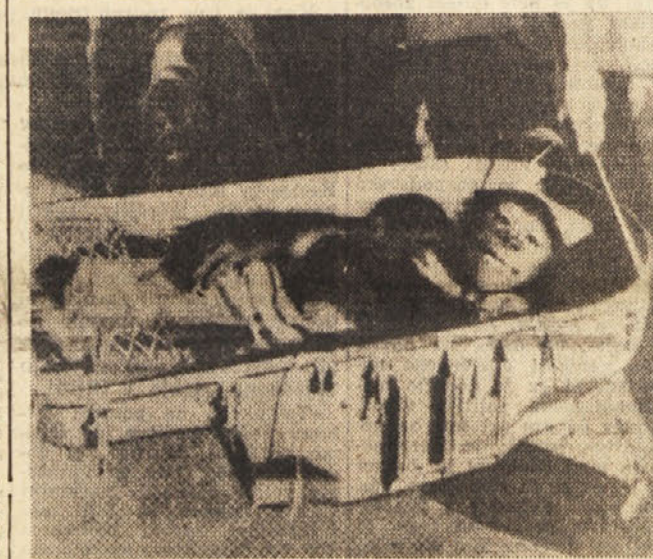
Simpanz, ki je z raketo «Redstones» poletel v vesolje. Tukaj je v svoji posebni »žibelki«