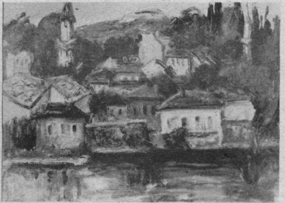
Milena Šotra: Motiv iz Trebinje, olje na platnu, 1973