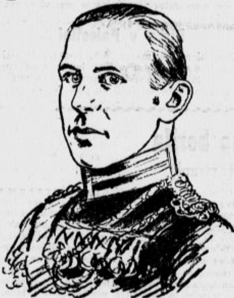
Grški kralj Jurij II

Grčija slavi te dni veselji jubilej, ko se spominja dneva, ko je pred 118 leti dobila svojo narodno državo in se izvila iz turškega oklepa, ki je vkoval ves Balkan v suženstvo. Njena osvoboditev se je zgodila v podobnih okolščinah, kakor osvoboditev Srbije. To je tudi en razlog več, da se vsa Jugoslavija danes z Grčijo raduje ob praznovanju velikega spominskega dneva slobode. Na Balkanu je ostal neokrnjen in neoslavljen isti duh, ki je narode pred sto leti začel osvobajati, ki jim je pripomogel do rasti in ki bo tudi v bodočnosti varoval trajanje njihove slobode. Praznik grške slobode, ki je bila plod junštva, je praznik vseh narodov na Balkanu, združenih danes v trdni zvezi, da jo skupno branijo.