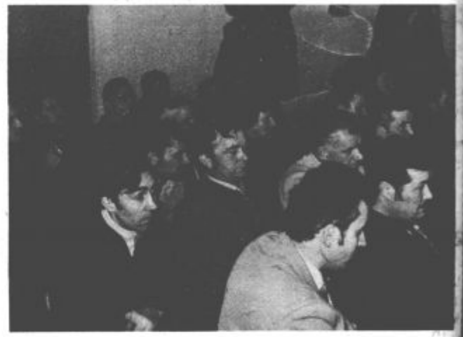
Ali jim bodo vzeli cesto?

Prav tako zahtevajo tudi povračilo stroškov, ker bi se v tem primeru oddaljenost povečala v eno smer za približno štiri kilometre. REK pa se mora obvezati, da bo v najkrajšem času spet usposobil cesto Jezero-Hrastovec za promet.