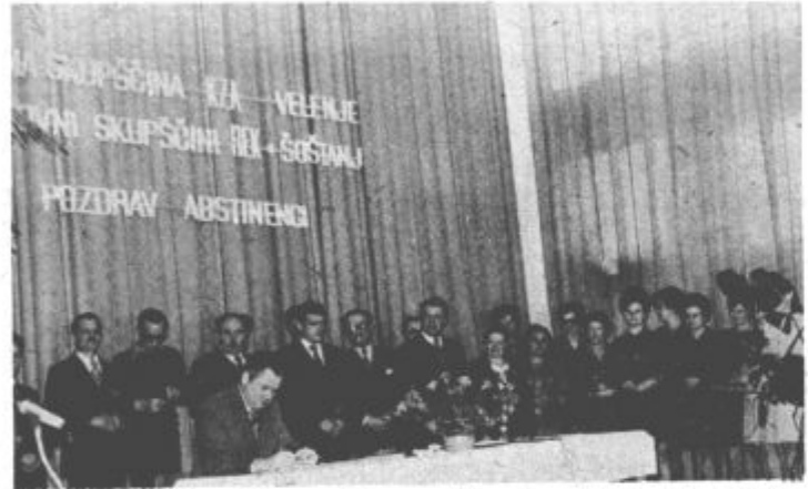
„Pozdrav abstinenci“ - pod tem geslom je potekala druga letna skupščina kluba zdravljenih alkoholikov Velenje.