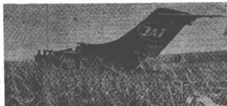
SREČA V NESREČI JATOVEGA LETALA DC-9: Na sliki so ostanki Jatovega letala DC-9, ki je v soboto, 23. novembra zasilno pristalo blizu beogradskega letališča. Letalo je tega dne nekaj po 16. uri vzletelo s pariškega letališča Orly in poletelo proti Beogradu. V njem je bilo 44 potnikov. Polet je potekal normalno vse dotlej, dokler se letalo ni približalo beograskemu letališču. Iz neznanih vzrokov je zgrešilo pristajalno stezo in priletelo na koruzno njivo, drselo nekaj sto metrov po razmočeni zemlji in se ustavilo. Takoj ko so vsi potniki zapustili letalo je DC-9 začel goreti. Zakaj je moralo letalo zasilno pristati, za zdaj še ni znano.