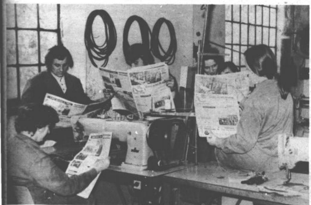
„Naš čas“ ima vse več zvestih bralcev tudi v delovnih skupnostih v občini Slovenj Gradec. Zadnje številko, kateri je bila priložena še priloga „Samoupravno sporazumevanje v Mislinjski dolini“ s predlogi delovnih programov samoupravnih interesnih skupnosti za leto 1975, so z zanimanjem prebirali v vseh temeljnih organizacijah združenega dela v Mislinjski dolini.

PREDSEDNIKI SVETOV KRAJEVNIH SKUPNOSTI OBČINE VELENJE